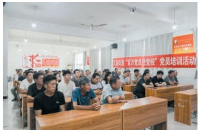
开展“百万党员进党校”党员培训活动。

该街道坚持以习近平新时代中国特色社会主义思想为指导,深入学习贯彻党的二十大精神、二十届三中全会精神,省委十一届七次全会精神,市委十二届六次全会精神,切实守牢意识形态底线,积极开展党史学习教育,开展理论宣讲,扎实推进党纪学习教育,把新修订的《中国共产党纪律处分条例》作为“床头书”“手中卷”,利用第一议题、理论学习中心组学习,通过“研学”“集中学”“自主学”等方法举措,不断筑牢思想根基、坚定理想信念。在警示教育中检视反思、以案明纪,教育引导党员干部知纪、知纪、明纪、守纪,真正把遵规守纪刻印在心中,使学习党纪的过程成为增强纪律意识、提高党性修养的过程。将做好党纪学习教育长效化同落实党中央、省委、市委和区党工委决策部署、当前重点工作、中心任务紧密结合起来,用高标准、严要求、实举措推动各项工作“更上一层楼”。