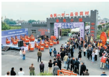
特色农业树典范,葡萄小镇促增收。

高新区(示范区)要在打造中国式现代化建设河南实践先行区中成为重要增长极,担当作为、务实重干的文昌街道紧紧围绕区党工委、管委会的决策部署,以高质量党建引领高质量发展,鼓足干劲、深化改革,统筹推进经济发展、项目建设、乡村振兴、安全稳定等重点工作,为打造重要增长极,澎湃新活力,贡献繁荣昌盛的文昌力量。