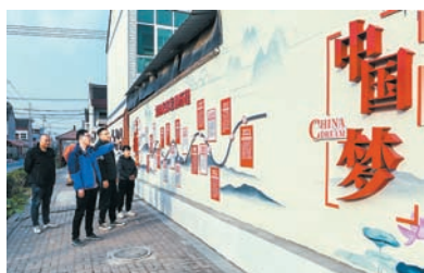
建好党建文化长廊。

狠抓“五星”支部创建,组织活力不断提升。该镇以“四动机制”(党群联动、问题驱动、机制推动、示范带动)为抓手,结合镇情实际抓两头带中间,进一步提高“四星”占比,力争实现全镇基层党组织一片红。截至2023年底,该镇创建“四星”支部2个,“三星”支部7个,“三星”以上村占比由2022年的27.8%增长到50%。