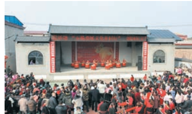
百场惠民文化乡村行。

筑牢综合治理防线。结合辖区实际,建立“首访负责制”矛盾调解机制,充分结合公安、司法等部门,统筹推进矛盾纠纷排查化解、社会治安突出问题整治等工作。稳步推进禁种铲毒、扫黑除恶、宗教治理、六防六促、“三零”创建、平安法治星创建和未成年人保护等工作,严厉打击“黄、赌、毒、非”活动,加大“扫黄打非”专项检查,开展“扫黄打非”护苗宣传活动10余次。此外该街道与校企结合,开设法治宣传教育公益课堂,以宣传教育“软实力”,提升社会治理“硬水平”。