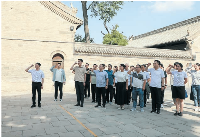
强化队伍建设,增强组织活力。