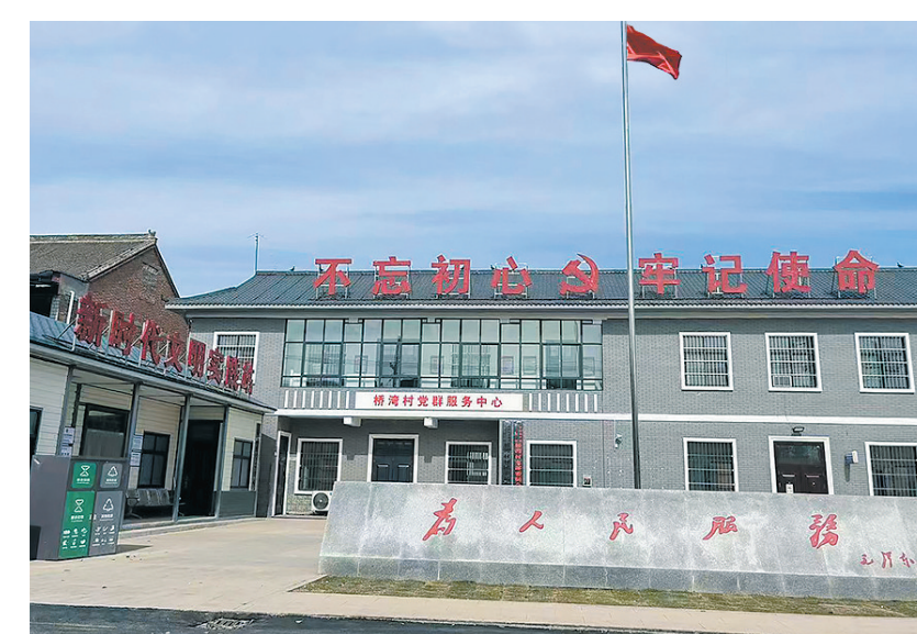
党群服务中心,便民服务惠民。