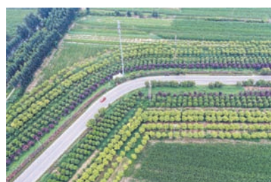
“四好”农村路,畅通乡村出行。

产业发展促进农民获得感、幸福感。该街道围绕“和美乡村”建设,完成东旭近村等8个村背街小巷硬化工程,硬化面积达40816.5平方米;完成杨楼村等13个村污水管网改造工程,李屯村等4个村主管网敷设已结束;积极配合推进“南水北调”饮水工程,与众惠水务公司对接,配合设计公司完成36个村与主管网接入点定位;持续开展“六清”“六乱”整治行动,发挥村