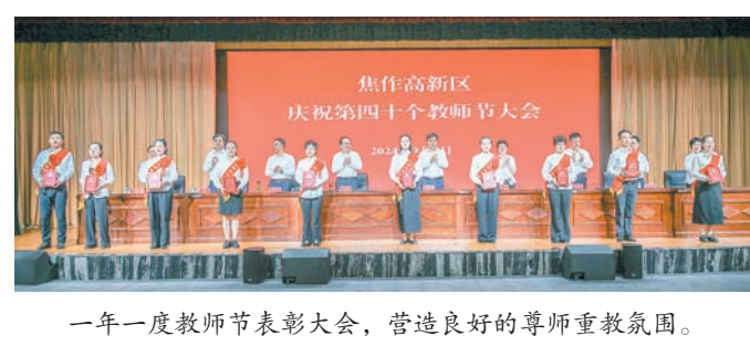
一年一度教师节表彰大会,营造良好的尊师重教氛围。