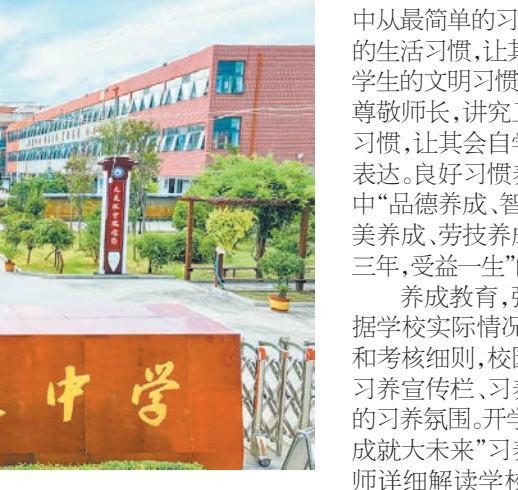
张庄初级中学校园一角。