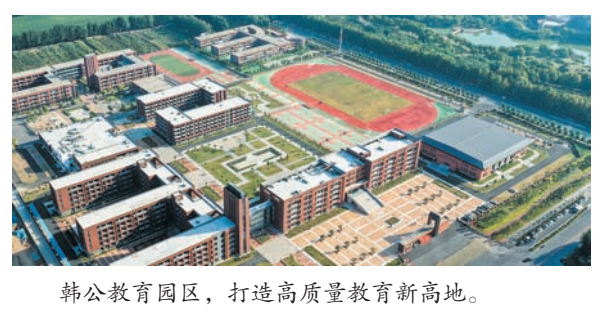
韩公教育园区,打造高质量教育新高地。