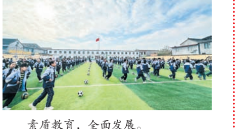
素质教育,全面发展。