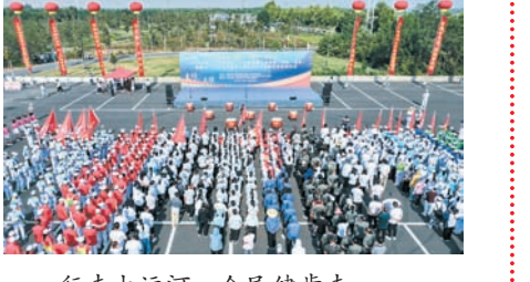
行走大运河,全民健步走。

从“大起来”到“强起来”人民更加满意 从“大起来”到“强起来”,该区教育园区步伐更加坚定,人民满意教育幼儿更加出彩。 党建引领“强起来”。该区教育工委设立学校党总支4个,党支部32个,实现教育系统党建工作全覆盖。去年以来,持续推动党组织领导的校长负责制改革,从试点推进到全面推开,高标准严要求推动改革事项。实验小学党支部获得河南省教育系统“四强”党支部称号,实验中学、二十八中、中心幼儿园三所学校党建工作示范校创建一次性通过。 立德树人“强起来”。该区把立德树人作为根本任务,加强思想政治教育,促进学生全面发展,进一步完善学生实践制度,强化科技教育和人文教育协同,实施青少年学生读书行动,让学生既具备科学精神、掌握科学知识,又提升人文素养、厚植文化自信。 发展质量“强起来”。该区进一步统筹推进学前教育、义务教育更加均衡更高质量,加快学校建设,加强品牌创建,推进教育公平,与北京师范大学深度合作,校长办校治校能力和一线教师专业素养不断提升。 素质提升“强起来”。该区广大教育工作者自觉弘扬教育家精神,提升管理能力,加强师德师风建设,促进教师专业发展,精心培育一批具有远见卓识、创新思维的名校长、名教师、名班主任,倾力打造一支师德高尚、业务精湛、结构合理、充满活力的高素质专业化教师队伍。 安全防范“强起来”。该区始终绷紧校园安全管理这根弦,安全网格化管理全覆盖,“安排—自查—督查—整改—回头看—推进”的学校安全工作运行机制全面形成,“人防、物防、技防”建设全面加强,全区安全形势平稳,全区校内未发生较大安全事故;区实验中学获评省级平安建设示范校。 支撑保障“强起来”。该区坚持教育优先发展理念,进一步落实各类政策待遇,持续为教育减负,凝聚工作合力,落实好各项政策环境保障,合力推动教育高质量发展。 赓续优良传统,弘扬尊师风尚,浓厚重教氛围,该区将持续以建设教育强区为目标,持续发挥党建引领作用,不断提升工作质量和水平,切实推动各项工作高质量发展,不断开创高新区教育事业改革发展新局面,为打造中国式现代化河南实践先行区中成为重要增长极贡献教育力量。