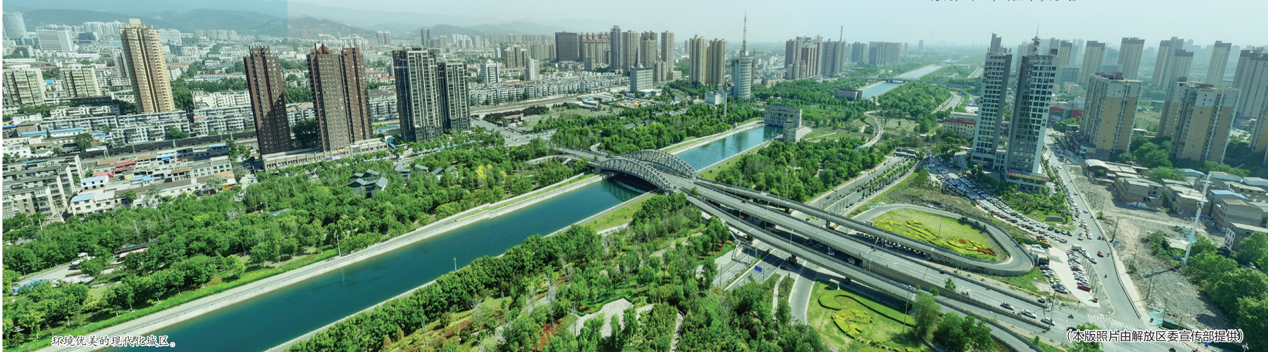
环境优美的现代化城区。