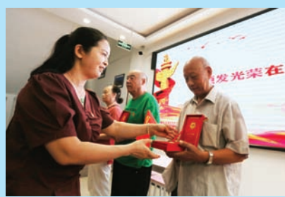
向老党员颁发纪念章。