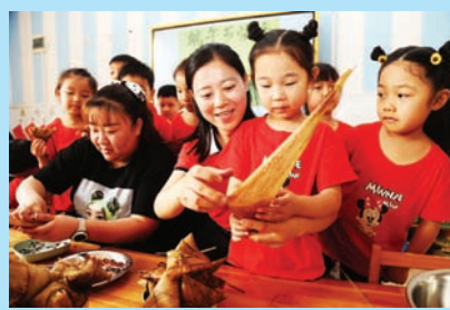
端午节教小朋友包粽子。

特别是今年年初以来，面对严峻复杂的外部环境和艰巨繁重的改革发展稳定任务，解放区坚持以习近平新时代中国特色社会主义思想为指导，全面贯彻党的二十大精神及二十届二、三中全会精神，在省委、市委的坚强领导下，团结带领全区上下，全力以赴拼经济、铆足干劲促发展，以非凡的勇气和坚毅的决心战胜重重挑战，锚定“坚持以发展现代服务业为主攻方向，推进数字经济和实体经济深度融合，加快建设宜居宜业宜游现代化城区”总的发展目标和定位，进一步全面深化改革，举全区之力全面打响数字赋新、商旅出新、工业上新、金融促新“四新会战”，奋力开创解放“二次创业”新局面，在打造中国式现代化建设河南实践先行区中争先锋、作表率。