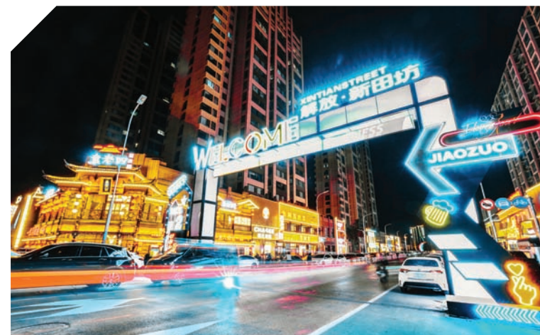
流光溢彩的解放·新田坊。