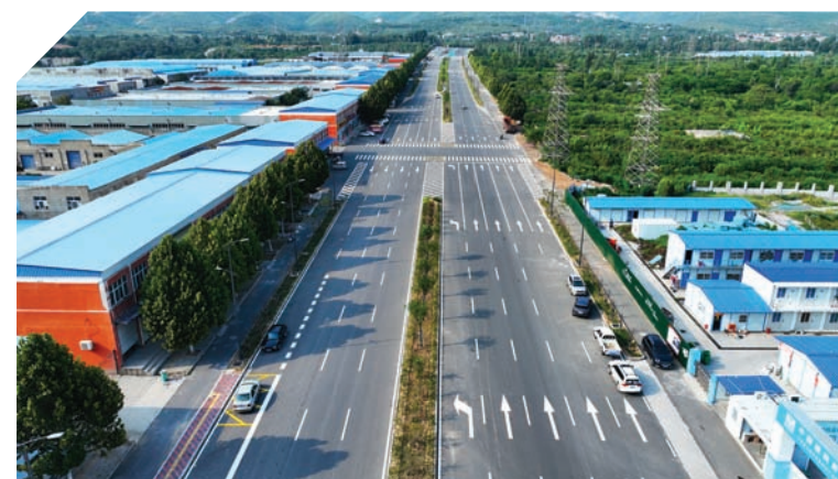
即将全线通车的牧野路。

不断激发“干”的动力。制定激励担当作为措施13条，坚持考核结果与干部提拔任用、职级晋升、年度评优等挂钩，今年年初以来调整干部6批172人次，有力激发了干部干事创业的积极性。严肃“干”的作风。通过开展党纪学习教育，集中整治群众身边不正之风和腐败问题，一体推进“三不腐”。目前共立案114人，党纪政务处分135人，组织处理52人次，风清气正的政治生态不断巩固提升。