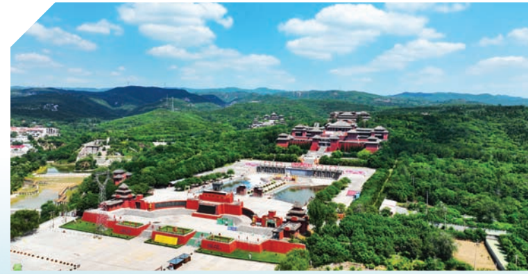
掩映在群山中的焦作影视城。