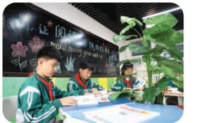
图书馆里静悄悄,学习思考乐陶陶。