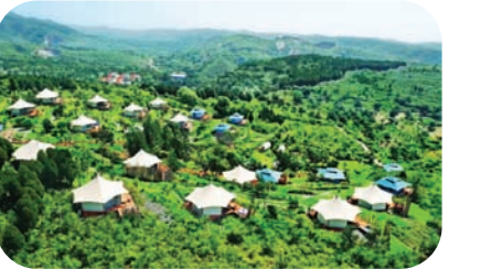
走进蟒河帐篷营地,来一场山谷里的约会。

营、果蔬采摘、自助烧烤、篝火晚会、观看露天电影等,还可以走进明清古建筑群,感受传统民俗文化的底蕴。深入挖掘历史文化、自然生态、红色遗址等资源,坚持因地制宜促进