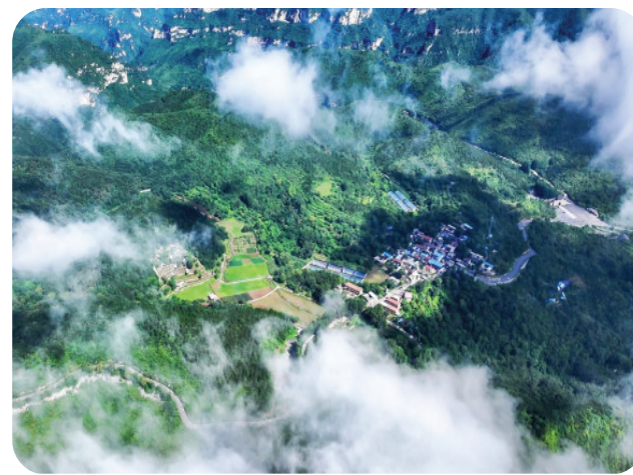
天然氧吧北业云 returned。

坚持在稳定中推动发展,在进取中筑牢根基,在新进中破解难题,中站经济必将乘风破浪,驶向高质量发展新航程。