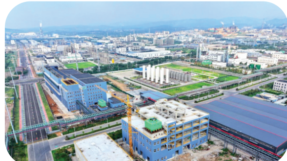
“三十一工程”项目之一的河南佰利新材料股份有限公司锂电材料项目。