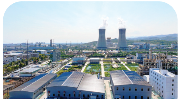
仅历时6个月建成投产的河南安彩半导体有限公司高纯石英制品项目。