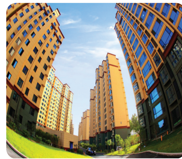
中站区安置小区——和悦小区。

医疗、养老、就业……民生福祉持续提升,让中站区在焦作居民心中的地位迅速攀升。 以更大的力度、更实的举措不断提升民生“温度”,用实际行动标注群众的幸福“刻度”,中站区够给力。