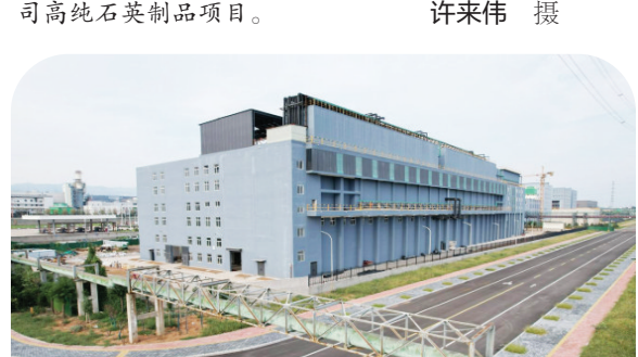
加快产能建设,降低开发区用气成本。