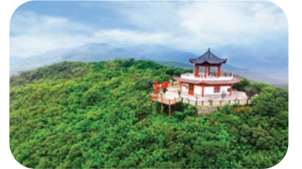
中站区太行八英纪念馆。

市场细分,满足个性化需求。 红色研学游、绿色生态游、蓝色体育游、古色民居游、特色非遗游,中站区推出的五条精品旅游线路,“串联”起特色各异的景点、景区。游客可以在十二会村参观太行第四专区及焦作市党政军机关旧址,可以参加露