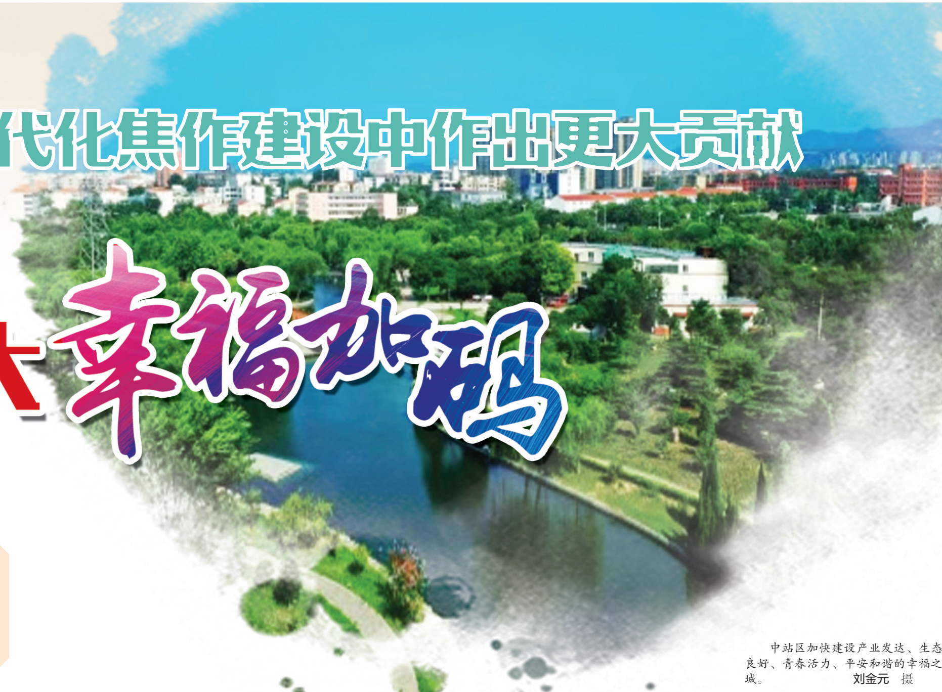
中站区加快建设产业发达、生态良好、青春活力、平安和谐的幸福之城。

引领,厚植工业优势,加快产城融合,以进一步全面深化改革为动力,锚定“两个确保”,围绕“四个聚焦”,争创“四个一流”,真抓实干、奋勇争先,全力打造全市工业高质量发展核心区、创新引领产业发展先行区、山城一体产城融合示范区,努力在现代化焦作建设中作出更大贡献。