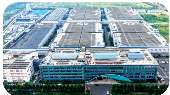
“三十一工程”项目之一的多氟多新能源(宁福巨湾)科技有限公司年产8GWh动力电池项目。