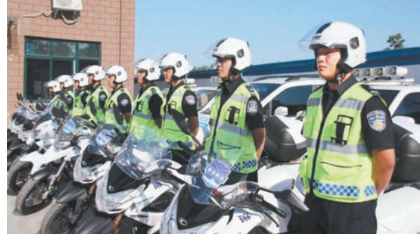
中站区域管局持续凝心铸魂,狠抓纪律,打造城市管理“执法铁军”。

新征程上,中站区域管局在深下基层、接实地气中,不断提高党性修养,致力于将其内化为崇高的理想信念和正确的价值追求,以此获得奋斗不止、精神不怠的动力源泉,获得明辨是非、廓清迷雾的政治慧眼,通过扎实推进大城管格局体系构建,由以往粗放式管理模式渐变为精细化智慧赋能,进一步提升解决实际问题能力,更好地在新时代中为城市高品质发展贡献城管力量。