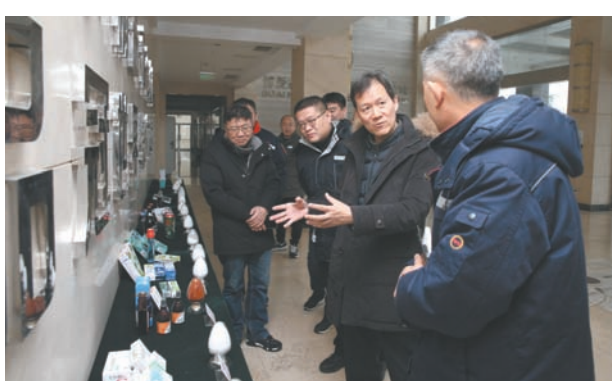
公司领导到新开源公司走访调研。

善小同行暖人心。组织党员服务队参与服务安全生产、营销服务、乡村振兴、文明城市创建,开展志愿服务进企业、进乡村、进学校、进厂矿活动,定期慰问走访贫困户、独居老人、留守儿童等各类志愿服务项目达40余次。排头兵,自当一马当先。在焦作电力行业,国网博爱县供电公司通过探索“1+2+3+N”党建工作体系,充分融合“老事新做+项目化实践”,在不额外增加工作负担的情况下进行资源整合,兼并了重复性工作,推动党建工作做实做深做细做出了新意。荣誉接踵而至。2023年度河南省全域营商环境评价中,该公司“获得电力”指标全省第一。还先后荣获河南省先进基层党组织、河南省先进基层党组织、国网河南省电力公司文明单位标兵、焦作市先进基层党组织等荣誉称号。