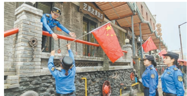
中站区域管局国庆节期间在主次干道悬挂国旗,打造“党建红”引领“城管蓝”浓郁氛围。