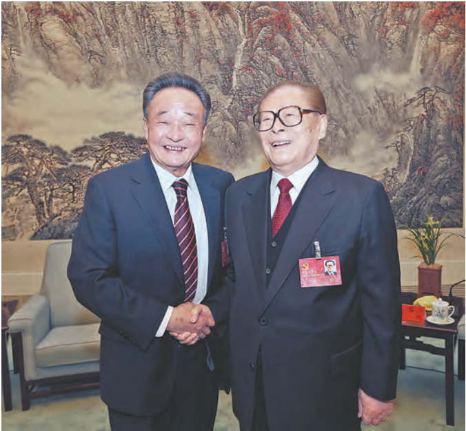
2012年11月14日，中国共产党第十八次全国代表大会在北京闭幕。这是闭幕会前，江泽民同志与吴邦国同志在一起。