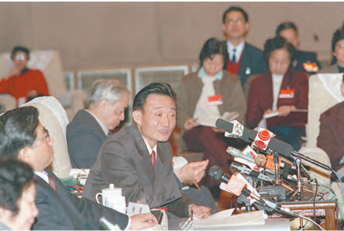
1994年3月，时任上海市委书记的吴邦国同志在全国两会上海代表团全团会议上。