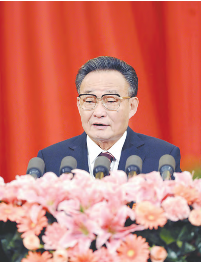
2011年3月10日，十一届全国人大四次会议在北京人民大会堂举行第二次全体会议。吴邦国同志作全国人民代表大会常务委