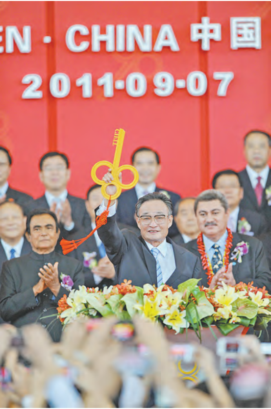
2011年9月7日，吴邦国同志在福建厦门出席第十五届中国国际投资贸易洽谈会开馆式。

吴邦国同志是中国特色社会主义民主法治建设的重要领导者。他强调，如果没有比较完备的、高质量的法律法规，就谈不上实现社会主义民主政治的制度化、规范化和程序化，就谈不上依法治国、建设社会主义法治国家。在党中央领导下，他将立法工作作为全国人大及其常委会的首要任务，紧紧围绕党中央确定的立法工作目标，坚持科学立法、民主立法，适应社会主义市场经济发展、社会全面进步和加入世贸组织的新形势，把中国特色社会主义法律体系中基本的、急需的、条件成熟的法律作为立法重点，抓紧制定修改相关法律，集中开展法律清理工作。2003年3月，他担任中央宪法修改小组组长，在中央政治局常委会领导下主持宪法修改工作。由十届全国人大二次会议通过的宪法修正案，确立了“三个代表”重要思想在国家政治和社会生活中的指导地位，明确国家尊重和保障人权、依法保护公民的私有财产权和继承权等内容，对促进我国经济社会发展、推进中国特色社会主义民主法治建设具有重要意义。在他的主持下，第十届、十一届全国人大及其常委会共审议通过宪法修正案草案、法律草案、法律解释草案和有关法律问题的决定草案186件，包括物权法、企业破产法、企业所得税法、公务员法、行政许可法、治安管理处罚法、劳动合同法、未成年人保护法、妇女权益保障法、关于加强网络信息保护的决定等。在党中央领导下，他主持制定反分裂国家法，把党和国家对台工作的大政方针和政策措施以法律形式固定下来，为反对和遏制“台独”分裂活动、促进祖国和平统一提供有力法律保障。他主持对香港特别行政区基本法、澳门特别行政区基本法及其附件有关条款作出解释并通过相关决定，推动两个基本法正确实施和“一国两制”方针贯彻落实。他主持制定修改一系列对中国特色社会主义事业具有重大影响的法律，为推动形成中国特色社会主义法律体系作出重要贡献。他强调中国特色社会主义法律体系是动态的、开放的、发展的，必须随着中国特色社会主义实践的发展而发展。他强调人大工作必须坚持党的领导。人大各项工作都要有利于加强和改善党的领导，有利于巩固党的执政地位。这一点在任何时候都不能动摇。他坚持在新的起点上继续加强和改进立法工作，探索开展立法后评估，不断提高立法质量，推动宪法和法律有效实施。（下转A03版）