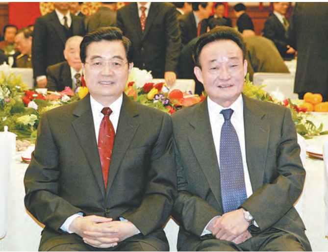
2005年1月1日，全国政协在北京举行新年茶话会。这是胡锦涛同志与吴邦国同志在一起。