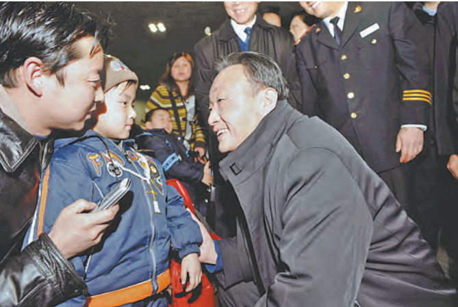
2008年2月3日，吴邦国同志在北京西站候车室与旅客交谈。