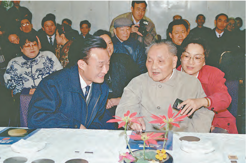
1992年2月10日，邓小平同志在上海贝岭微电子制造有限公司参观时与吴邦国同志交谈。