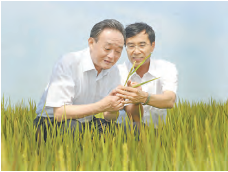
↑2012年7月19日，吴邦国同志在黑龙江农垦建三江管理局二道河农场万亩大地号察看水稻长势。