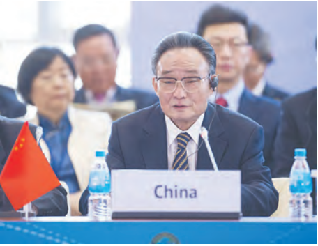
←2013年1月28日，吴邦国同志在俄罗斯符拉迪沃斯托克出席亚太议会论坛第21届年会，并作题为《坚持和平发展 促进合作共赢》的主旨发言。