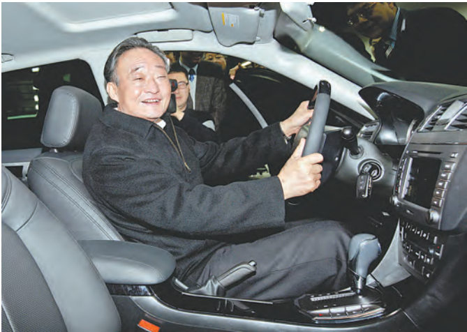
2010年1月30日，吴邦国同志在上海汽车集团股份有限公司技术中心察看新能源汽车。