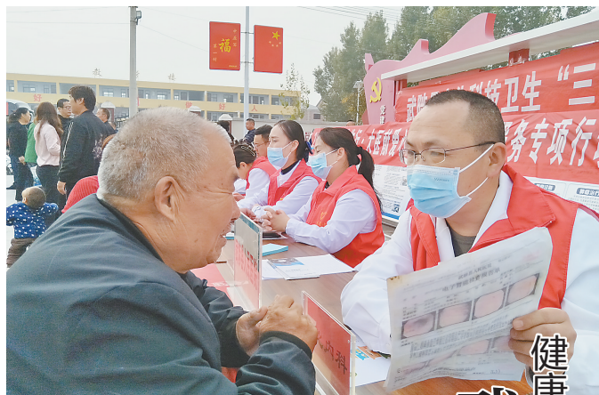
10月30日,武陟县开展的“健康焦作行 大医献爱心”文明实践志愿服务活动现场,健康志愿者在为群众义诊分析病情。

据新华社杭州10月31日电(记者唐弢、许舜达)记者31日从浙江省应急管理厅获悉,为应对台风“康妮”带来的大风暴雨影响,浙江省防指决定于31日16时将防台风应急响应提升至Ⅱ级,要求各地各部门坚持底线思维、极限思维,严格“八张风险清单”闭环管控,以预报预警为令,强化预警响应联动,坚决果断提前转移危险区人员,全面落实防御应对各项举措,确保人民群众生命财产安全。 据浙江省气象台消息,台风“康妮”已于31日14时前后在台湾省台东县成功镇沿海登陆,夜间进入台湾海峡,在福建省沿海转向东北方向移动,紧贴浙江沿海北上,不排除登陆浙江沿海的可能性。