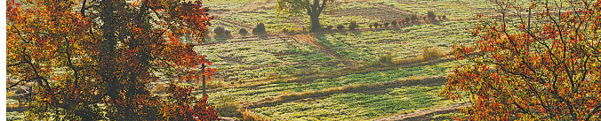
11月13日,在安徽省黄山市黟县卢村拍摄的冬日晨景(无人机照片)。

此外,本届电影节期间将围绕“与人民同行、与艺术共创”的主题开展电影工作者走基层公益慰问活动,包括第37届中国电影金鸡奖提名者表彰仪式、金鸡电影论坛、金鸡电影创投大会、2024金鸡电影生活节等多场文化活动也将同期举办。