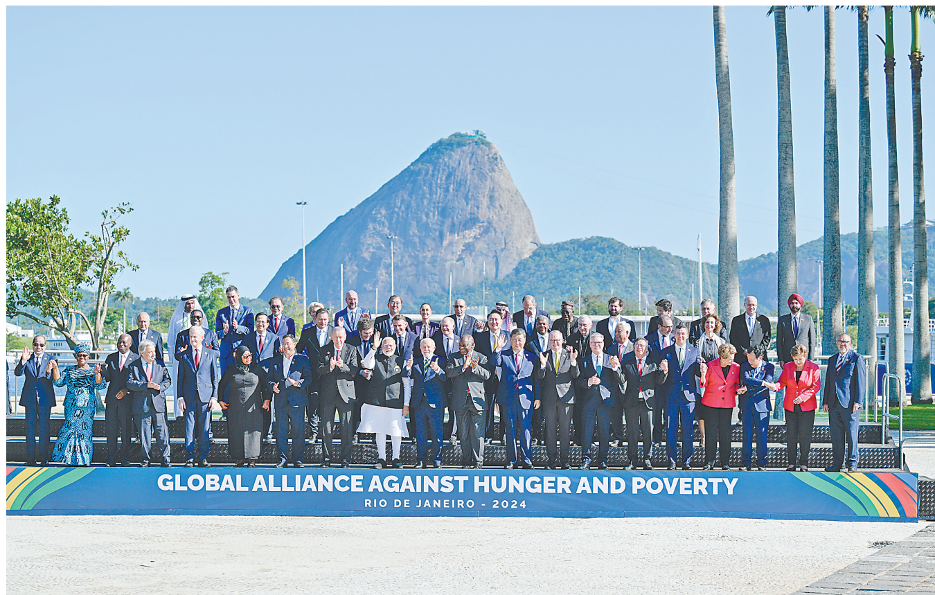
当地时间11月18日上午,国家主席习近平在巴西里约热内卢出席二十国集团领导人第十九次峰会。峰会把“构建公正的世界和可持续的星球”作为主题,并决定成立“抗击饥饿与贫困全球联盟”。这是习近平同与会领导人共同参加巴方发起的“抗击饥饿与贫困全球联盟”合影。

集团领导人杭州峰会时,首次将发展议题放到宏观经济政策协调的中心位置,这次里约热内卢峰会把“构建公正的世界和可持续的星球”作为主题,并决定成立“抗击饥饿与贫困全球联盟”。从杭州到里约热内卢,我们都致力于同一个目标,即建设一个共同发展的公正世界。为了建设这样的世界,我们要在贸易投资、发展合作等领域增加资源投入、做强发展机构,多一些合作桥梁,少一些“小院高墙”,让越来越多发展中国家过上好日子、实现现代化;要支持发展中国家采取可持续的生产和生活方式。(下转A02版①)