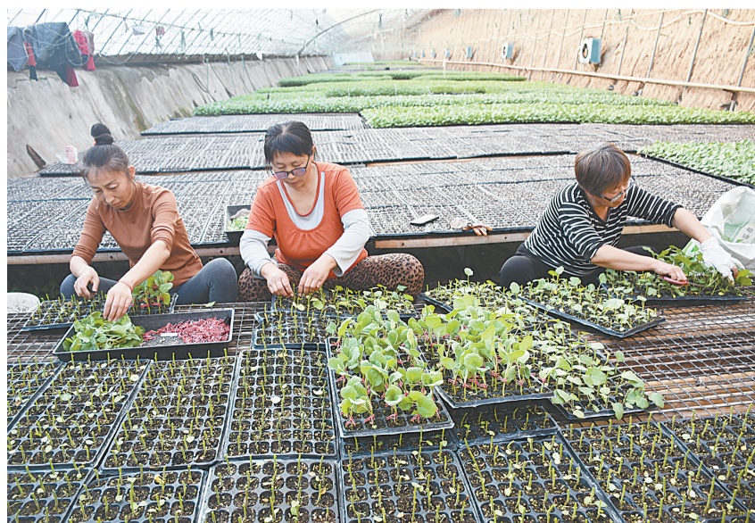
1月12日,孟州市阳光果蔬专业合作社的大棚里,村民在嫁接茄子苗。该合作社每年培育各类果蔬苗900多万株,通过订单销往河北、山西、陕西等省及该市周边地区,带动当地及周边发展果蔬种植4000余亩。

等新型经营主体的示范引领作用,重点发力,“零距离”指导农户做好因墒浇水、因苗追肥等,做到技术服务全覆盖,加强与气象等部门信息沟通,密切关注天气变化,提早制订预案,及时发布预警信息,做好冬季低温雨雪冰冻灾害天气防范应对工作。同时,提早构建农技专家、镇、村三级网络体系,前移责任关口,做到极端灾害天气防范应对措施到位,夯实组织基础,为保障粮食安全提供有力保障。截至目前,全市36.1万亩小麦已浇水31万余亩,整体苗情长势良好,其中一二类苗占比达75%。(赵春营 周萍)