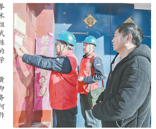
↑1月7日,国网温县供电公司黄庄供电所工作人员为黄庄镇黄庄村即将返乡人员的家门口贴上供电服务“连心卡”,确保群众返乡后,有任何用电问题都可以随时联系上电力工作人员。