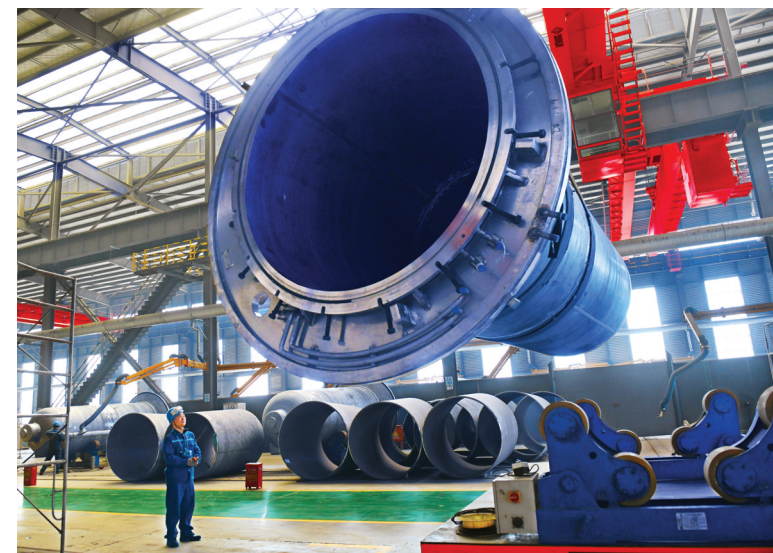
位于博爱经济技术开发区的河南龙佰智能装备制造有限公司工人在生产调运大型化工设备。