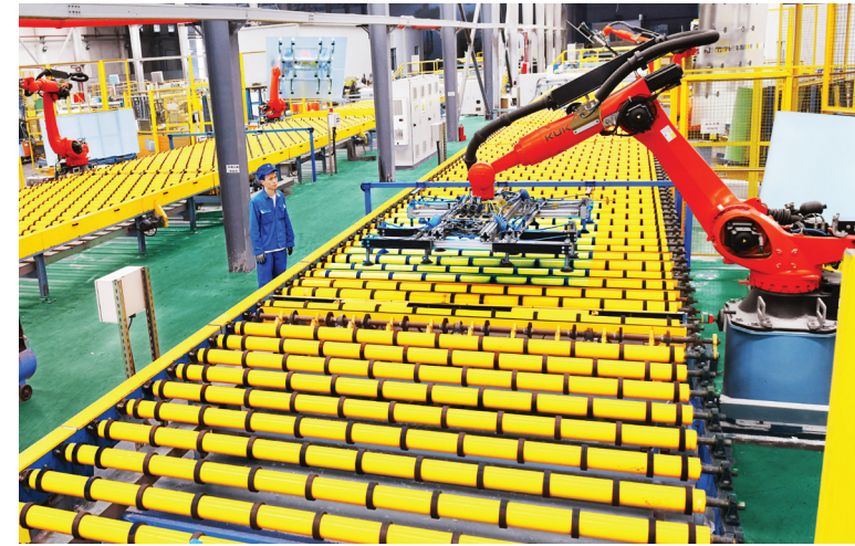
博爱经济技术开发区的焦作安彩新材料有限公司自动化生产线在生产太阳能光伏玻璃。

站在新的起点上，博爱经开区坚持聚焦延链补链强链生链，加快产业能级整体跃升，坚持不懈补短板、挖潜力、扬优势，全力以赴推动招商引资上水平、项目建设上台阶，争当开发区高质量发展的组织者、推动者、实践者，在加快打造中国式现代化建设河南先行区，奋力谱写新时代新征程中原更加出彩焦作新篇章中贡献澎湃力量。