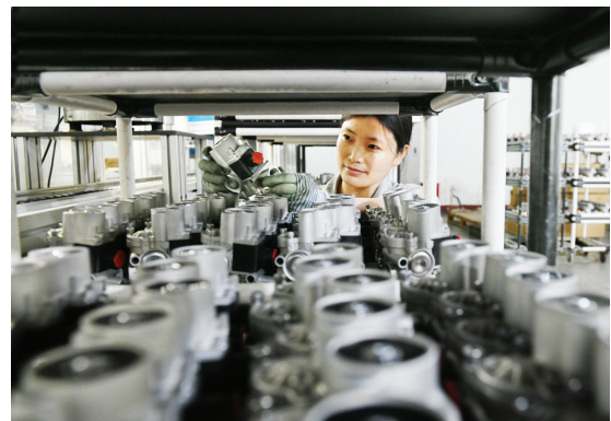
位于博爱经济技术开发区的焦作博瑞克控制技术有限公司技术人员在检验制动器配件质量。

加快产业主体培育，目前区内省级制造业单项冠军3家，分别为新开源、鑫鑫恒拓、亿水源；2024年，新增主导产业规模以上工业企业25家、高新技术企业7家、省级及以上专精特新企业7家。