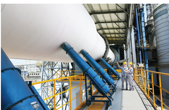
位于博爱经济技术开发区的河南亿水源净水材料科技有限公司工人在巡检回运转运行状况。

截至目前，中交交联年产3200万米电缆一期、北星精工年产500吨氮化硅陶瓷制品、中汇年产200万件新能源增程式凸轮轴等29个县重点项目已成功建成并投产达效。在去年全市一季度重点项目观摩活