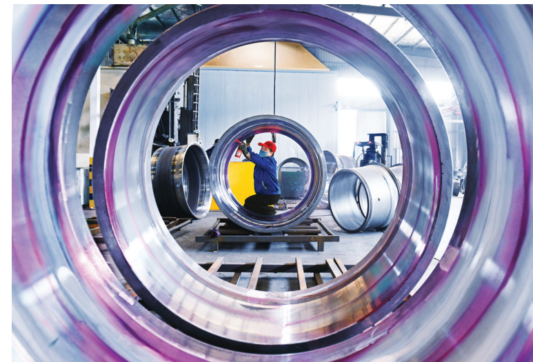
位于博爱经济技术开发区的宏源精工车轮（焦作）有限公司工人在检验车轮。