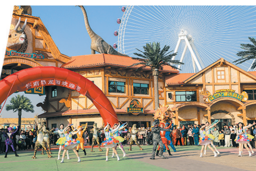
怀府恐龙园重磅打造明星文旅项目。

深化重点领域改革。聚焦党的二十届三中全会精神，坚持以经济体制改革为牵引，推动各项改革任务落实。巩固开发区“三化三制”改革成果，强化管委会政策制定、发展规划、行政审批等职能，加快形成市场主导、政府支持、高效运转的管理运营体制。稳妥推进农村改革，积极探索农业社会化服务新模式；以农村产权公开交易为突破口，发展