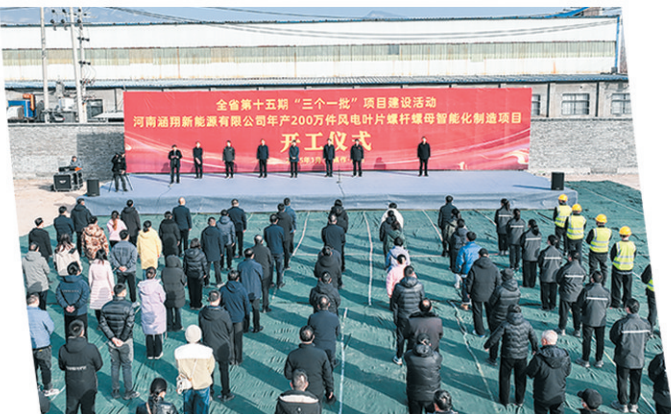
以“三个一批”项目建设为引领，蓄势赋能产业链做大做强。