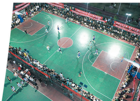
“村BA”年年上演，火爆“出圈”。