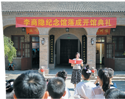
高标准建设名人纪念馆，成为旅游新景点。