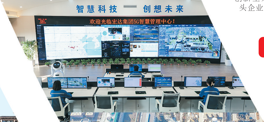
智慧化赋能，宏达集团转型发展树标杆。