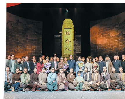
大型红色现代怀梆剧《杨介人》。