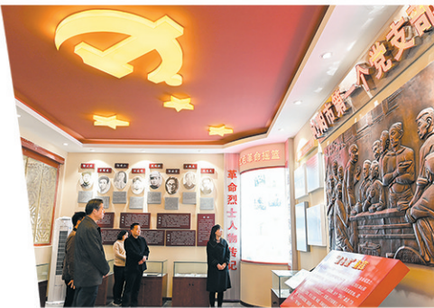
弘扬红色文化，打造党员教育基地。