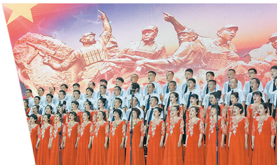
新时代文明实践活动内容丰富多彩。

做强产业支撑。加快推进总投资1.15亿元的4个新开工项目尽快实施；积极推动总投资3.4亿元的3个谋划项目落地。加强丹河峡谷旅游开发，重点发展高端民宿和文旅研学。积极筹办第二十届“神农山文化旅游节”，持续做强“文旅+”品牌，争创3个焦作市A级乡村旅游村，吸引更多人流。