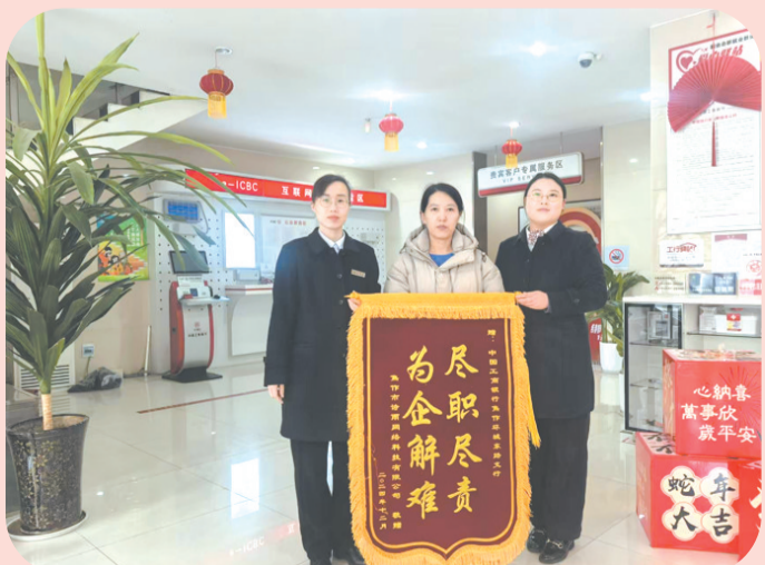
工行焦作环城东路支行营业室始终秉持“客户至上”的原则，帮助某单位解决账户使用难题，单位负责人送来锦旗表示对工行工作的认可。