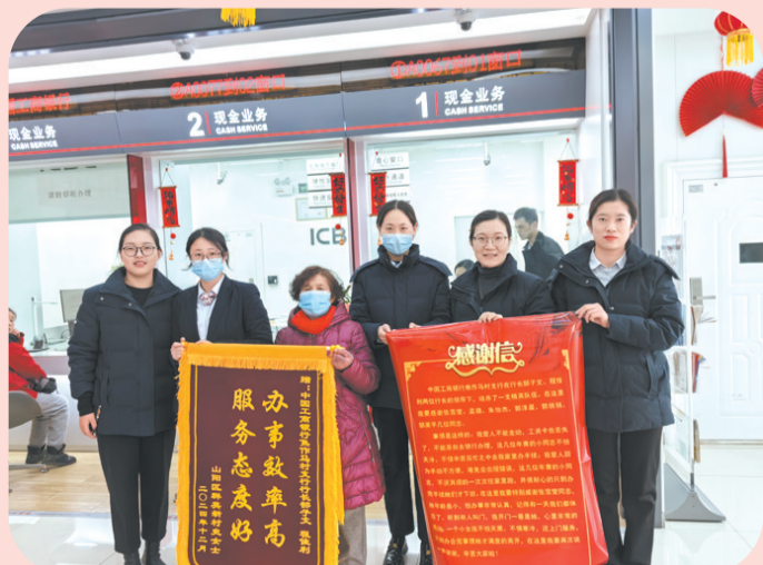
2025年1月2日，工行马村支行为行动不便的客户提供上门服务，客户家属赠送锦旗和感谢信表示对支行的认可与感谢。