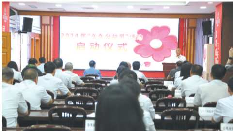
2024年9月5日，焦作市慈善总会在工行焦作分行举行2024年“久久公益节”活动启动仪式。