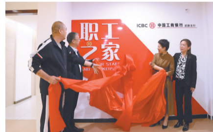
为进一步将关心关爱员工落到实处，丰富员工业余生活、缓解工作压力，让广大员工感受到“家”的温暖，在工行焦作分行党委和工会的大力支持下，武陟支行对“职工之家”进行焕新升级，并于近日举行了揭牌仪式。

据统计，2024年，在全市金融系统房地产贷款中，该分行审批项目数量第一、审批金额第一、发放金额第一、发放利率最低等，创下了房地产市场四项第一，受到市委、市政府高度赞扬。