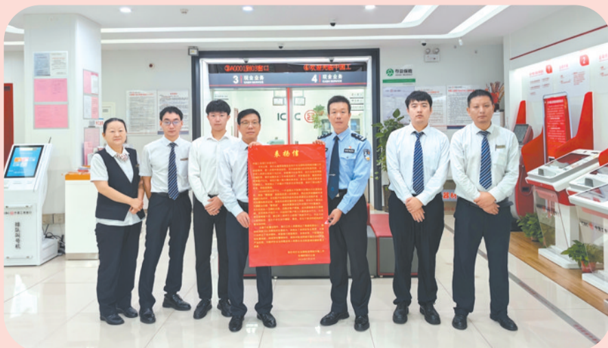
焦作市打击治理电信网络诈骗工作协调机制办公室警官为工行焦作中铝支行送上表扬信，对该支行有效拦截一笔大额涉案资金、配合公安机关抓获涉诈嫌疑人、有效阻止诈骗分子的非法获利企图、保护群众财产安全给予表扬和感谢。