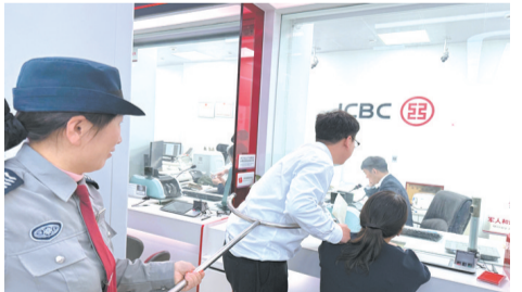
工行中站支行班后组织开展防抢演练，增强员工安全意识与应急处置能力。