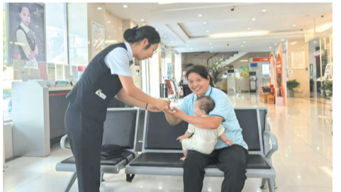
2024年8月26日，工行焦作环城东路支行持续落实厅堂等候“一杯水”贴心服务举措，为带孩子的客户递上一杯水，有效提高客户排队等候时的服务体验。