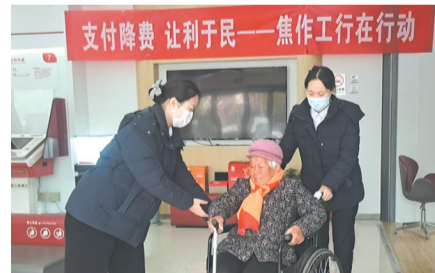
2024年12月18日，工行马村支行客服经理主动搀扶行动不便的老人协助其办理业务，提供暖心服务获得客户好评。