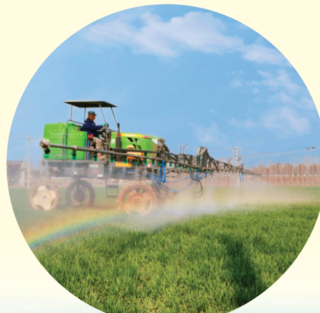
科技支撑农业快速发展。