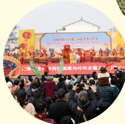
群众文化活动搞得有声有色。