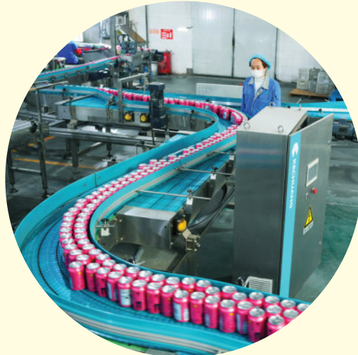
位于孟州市谷旦镇的焦作来奇食品饮料有限公司包装生产线。