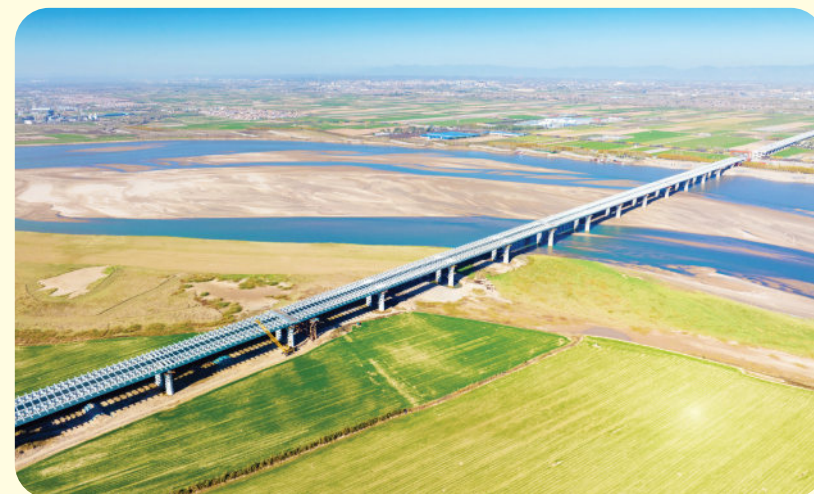
2024年11月29日，沁伊高速黄河特大桥顺利合龙。