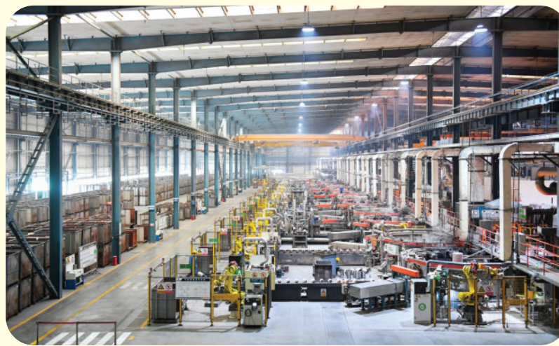
河南省低碳清洁能源内燃机摩擦副组件中试基地。