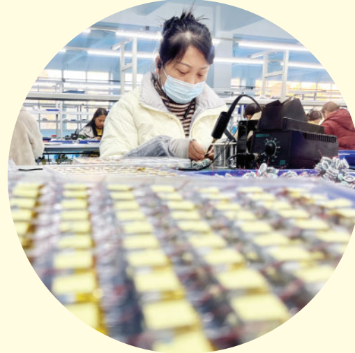
孟州市迪讯电子有限公司智能穿戴设备生产车间，工人在焊接零部件。