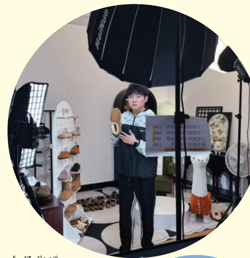
会昌街道一名主播在直播间销售鞋品。

抓手持续转变干部作风，全年提拔重用102人、职级晋升137人，处置问题线索792件、党纪政务处分355人，省委巡视反馈47项问题整改完成46项，干事氛围更加浓厚。