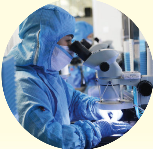
铸译电子员工在对开环马达进行外观检测。