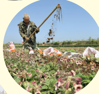
大力发展种植药材，让种药农户获利。