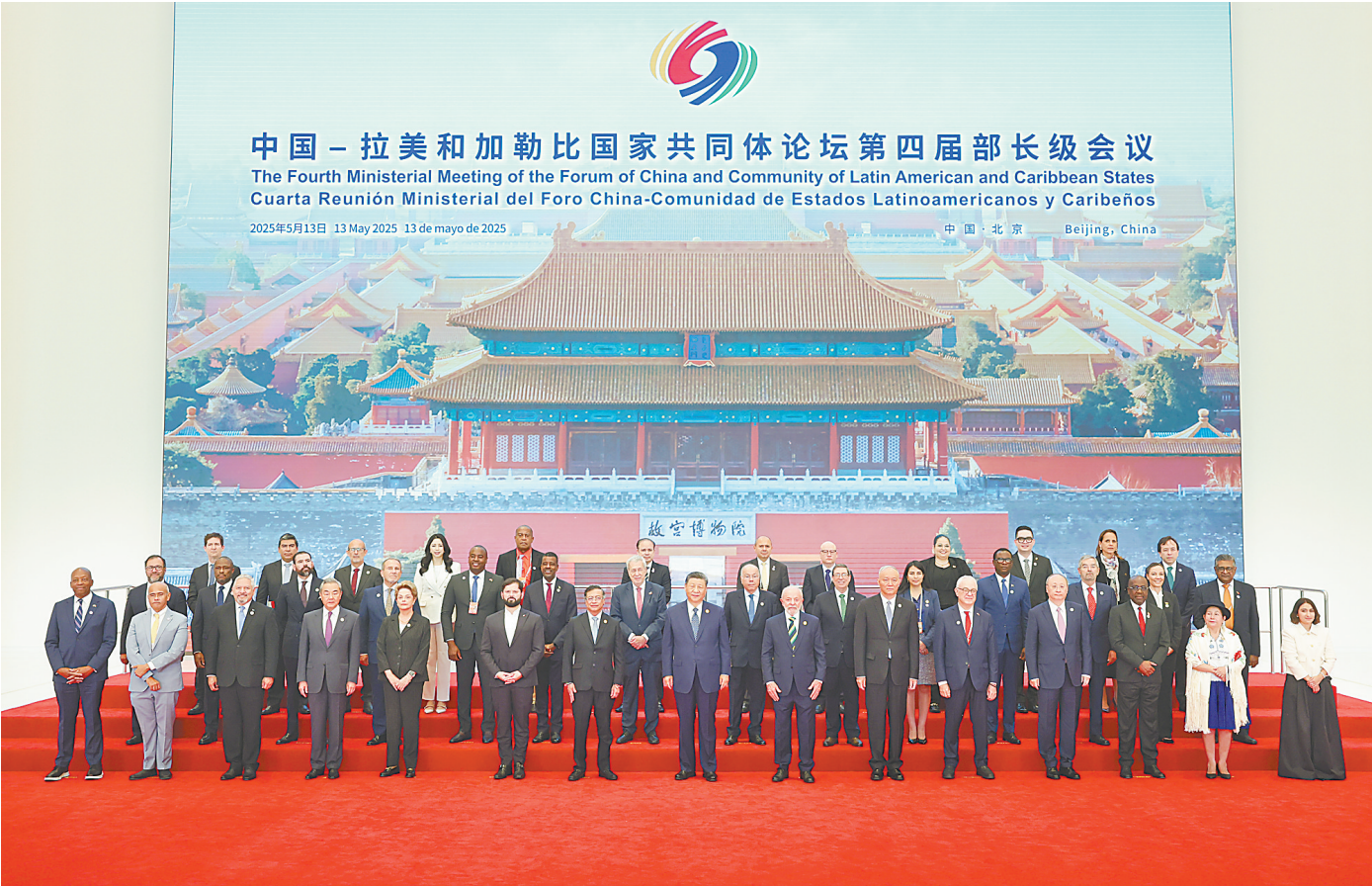
5月13日上午，国家主席习近平在北京国家会议中心出席中国—拉美和加勒比国家共同体论坛第四届部长级会议开幕式并发表主旨讲话。这是习近平同与会嘉宾集体合影。

新华社北京5月13日电（记者马卓言、冯歆然）5月13日上午，国家主席习近平在国家会议中心出席中国—拉美和加勒比国家共同体论坛第四届部长级会议开幕式并发表主旨讲话。习近平宣布，中方同拉方携手启动五大工程，共谋发展振兴，共建中拉命运共同体。 初夏时节，生机盎然。国家会议中心内，中国、拉美和加勒比国家国旗以及有关地区组织旗帜交相辉映。 习近平同拉共体轮值主席国哥伦比亚总统佩特罗、巴西总统卢拉、智利总