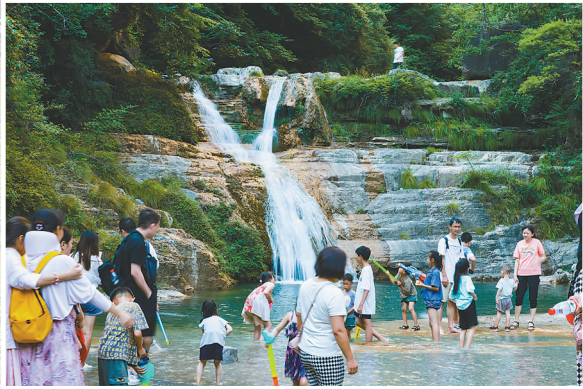
潭瀑峡内，游客们踏入浅溪，感受清凉夏日。