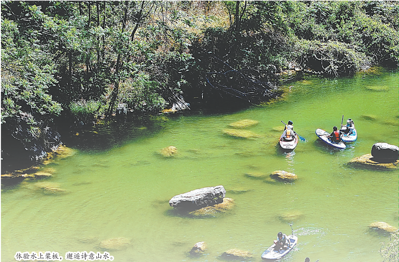
体验水上桨板，邂逅诗意山水。