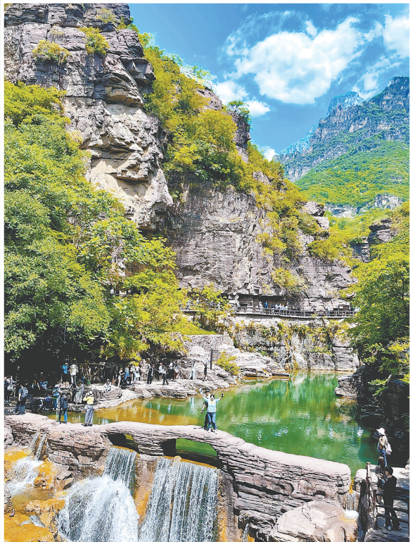
行走在丹崖碧水间，感受太行峡谷奇观的魅力。