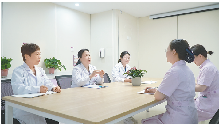
市妇幼保健院资深专家团队为产后宝妈们和新生儿制订护理方案。