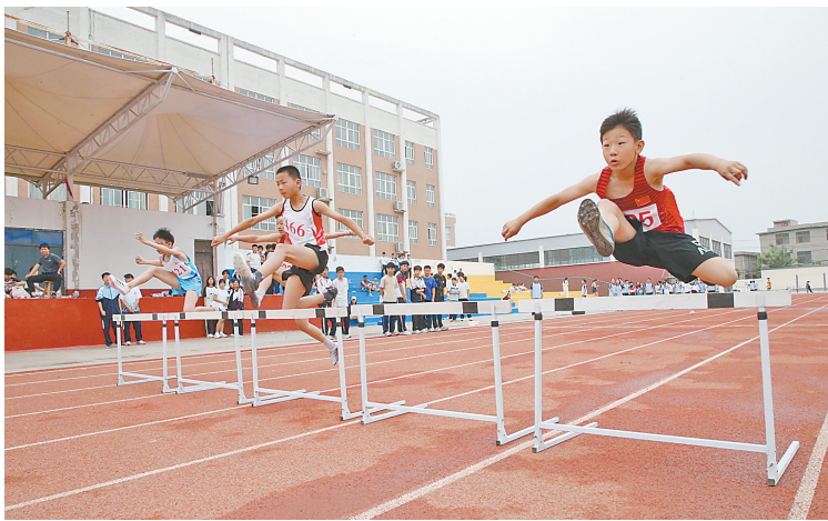
5月21日，解放区2025年中小学田径运动会开幕。本次运动会为期2天，设初中男女组、小学男女组两大组别，23支中小学校代表队的400余名运动员参加短跑、跳高、跳远、团体接力等24个小项的角逐。李良贵 摄

自2006年成立以来，王褚预防接种门诊持续深耕服务升级，先后获评“河南省示范化门诊”“焦作市预防接种服务示范示教单位”，通过创优项目进一步做好门诊升级改造和能力提升，一是优化管理，通过数字化系统实现疫苗全流程分色标识、24小时温控监测，让宝宝接种更安心；二是贴心服务，打造“疫苗小姐姐”陪护、儿童主题乐园、“宝宝成长阶梯”等特色项目，让接种更温馨；三是延伸服务，创新“成人疫苗处方”，融合家庭医生签约、儿童保健等资源，为居民提供全生命周期健康守护。