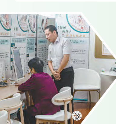
图⑤ 工作人员指导市民进行检测。