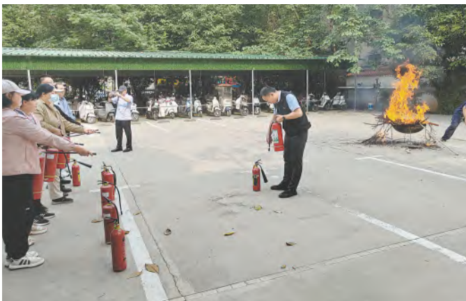
5月27日，工行焦作分行在机关本部组织员工开展高层建筑消防逃生、灭火演练。

能力。另一方面，外拓深耕，扩大宣传成效。辖内各网点共成立7支宣传小分队，开展“进单位、进工厂、进学校、进家庭、进社区、进村屯、进网点”集中宣传活动，引导群众自觉远离和抵制非法金融活动，树立理性投资理念。