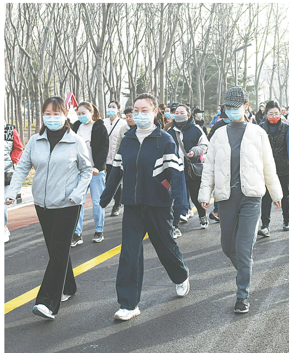
3月8日,山阳区妇联、文旅局联合组织开展环湖走活动。山阳区委区直机关、事业单位的300多名妇女党员干部参加了环湖走健身运动,以健康快乐方式庆祝自己的节日。

要突出创意设计,结合城市更新,保护好城市肌理和历史文脉,结合当代新业态、新场景进行老厂房的更新与活化,建设好焦作·百年矿业遗址公园、焦作老电厂文化艺术创意产业园、西大井红色旅游教育基地、陶圣源文创园区,培育城市高质量发展的新动力源。创意办好焦作·国际首创高塔实景演出、“醉美修武”等沉浸式演艺,推出100家非遗老字号特色美食门店,开展“文创进景区”活动,打造文旅文创消费新场景。开展传统村落保护利用工程,用文旅文创赋予乡村振兴新内涵,年内建设一批精品民宿和乡村旅游示范村,加快建设岸上小镇、龙翔山居、猫岔、许湾等高端民宿集群,构建“山居美学·山阳诗意”IP,打造“北方民宿之都”,树立乡村旅游“焦作样板”。