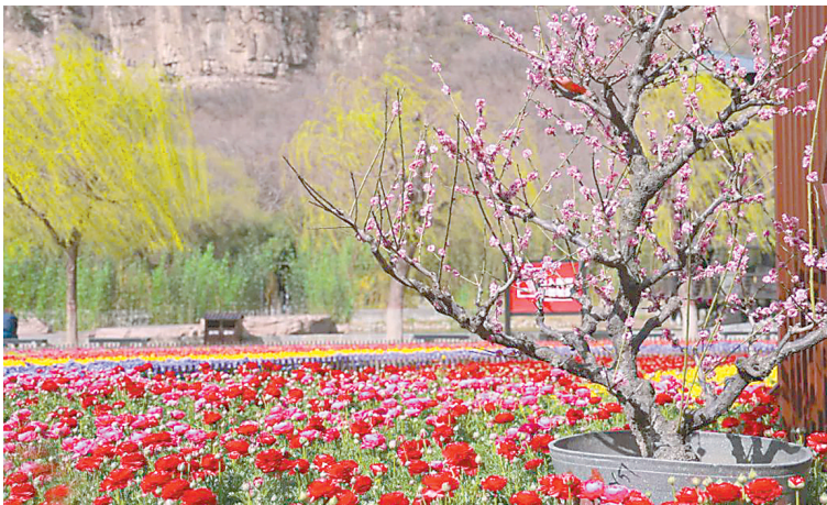
云台山春季山花烂漫。

如织,春风拂面柳芽发,各色花朵迎着春风摇曳怒放,组成醉人的五彩花海,呈现一幅春意盎然的山水画卷,装扮春日的云台山,你在画中游,我在景中看。丹崖碧水,同心同意,身旁是崖石似火,脚下