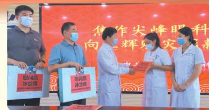
2021年8月2日上午,在该院党支部的统一组织下,短时间内就募集捐款15850元。这批捐款统一送到焦作市红十字会,专项用于卫辉市的抗洪救灾工作。