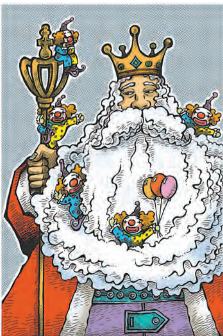
乐园(漫画) 杨树山 作