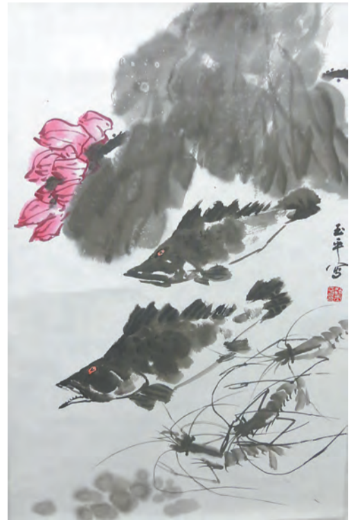
荷趣(国画) 赵玉平 作