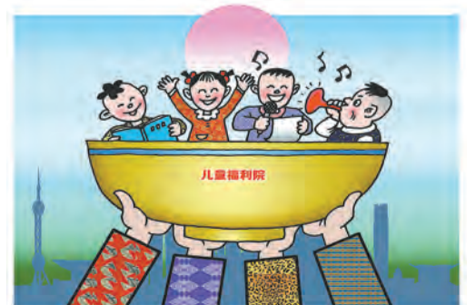
托起明天的希望(漫画) 顾培利 作