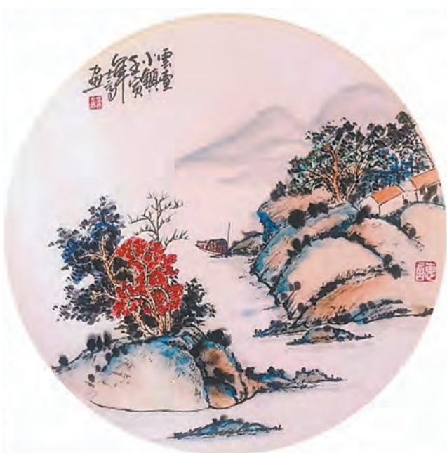
云台小镇(国画) 原士高 作