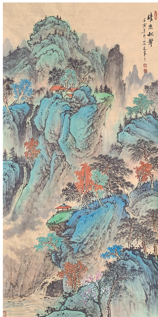
晴峦积翠(国画) 王安定 作