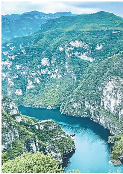
青龙峡魅力景色。

青龙峡森林覆盖率95%以上,是天然的清肺、避霾、养生、休闲、文化之地。主峰青龙峰海拔高达1323米,站在岭巅,大有“举目四观天下小”之感慨;波澜壮阔的望龙瀑、神奇独特的倒流泉、妙不可言的七彩潭、堪称一绝的“石上春秋,独具特色的溶洞景观,再加上天然原始的植物群落,构成了一幅幅极富创意的山水画卷。