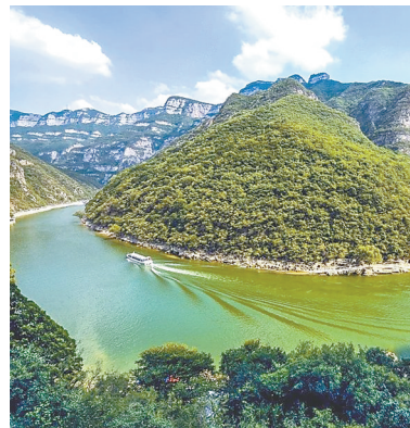
青天河美景如画。