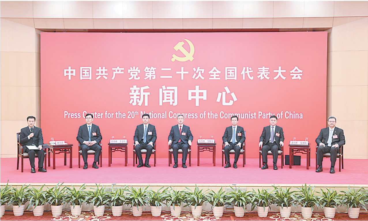
10月20日,中国共产党第二十次全国代表大会新闻中心举行集体采访。青海、宁夏、新疆、中央和国家机关、中央金融系统、中央企业系统(在京)代表团新闻发言人出席,介绍代表团学习讨论二十大报告情况,并回答记者提问。