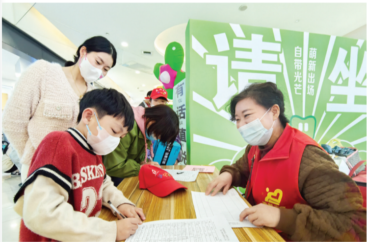
小记者登记捐赠的衣物。