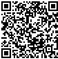
免费领票 扫二维码

目:陈式太极拳(械)、杨式太极拳(械)、吴式太极拳(械)、武式太极拳(械)、孙式太极拳(械)、和式太极拳(械)、其他太极拳(械)。集体项目有集体太极(八法五步)、集体太极拳、集体太极器械、集体太极拳械。