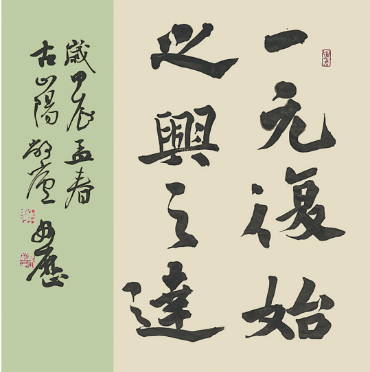
一元复始之兴之达(书法) 毋立 作