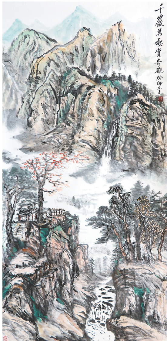
千巖万壑赏奇观(国画) 刘东来 作