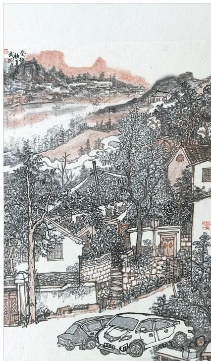
南太行古村落(国画) 孔武刚 作