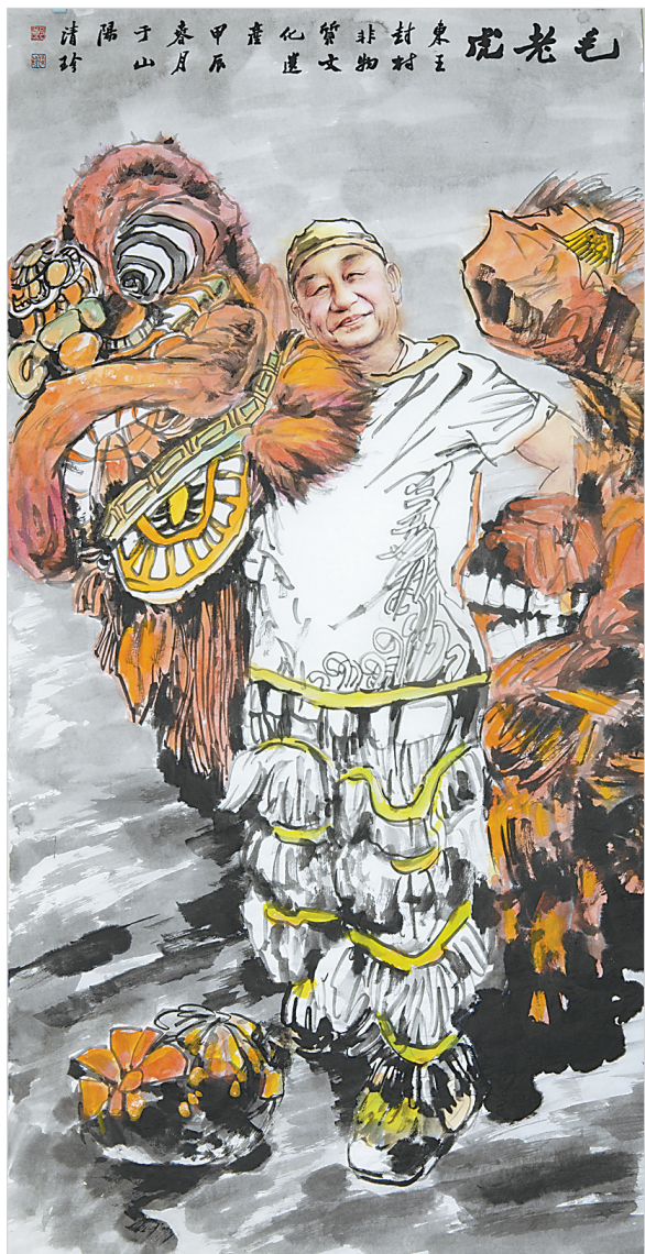
东王封非遗毛老虎(国画) 郑清珍 作