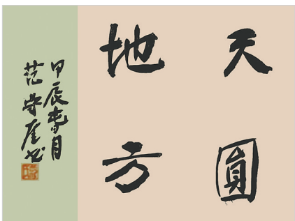
天圆地方(书法) 范守奎 作