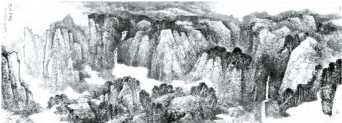
清泉石上流(国画) 李金富 作

红军不怕远征难,万水千山只等闲。 五岭逶迤腾细浪,乌蒙磅礴走泥丸。 金沙水拍云崖暖,大渡桥横铁索寒。 更喜岷山千里雪,三军过后尽开颜。(书法) 毋立作