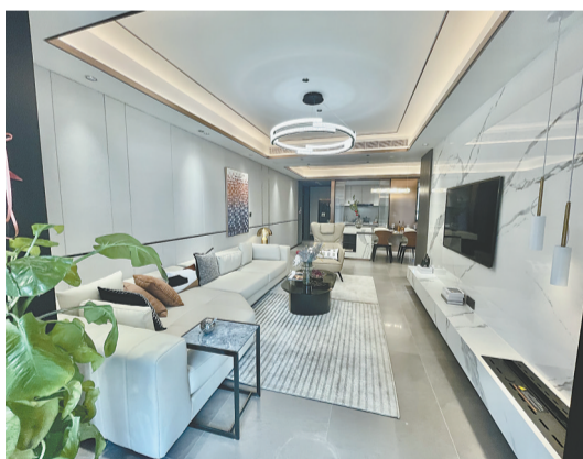
简单的背景墙设计让室内空间看起来更大。

拒绝复杂背景墙。在装修客厅时,很多人喜欢将电视背景墙打造成复杂的造型,或者用一些特殊的材质来彰显品位和个性。其实,复杂背景墙虽然美观大气,却容易过时且不易打理维护,尤其是对于小户型来说,复杂的背景墙会让空间看起来更加拥挤。简单的背景墙设计可以让摆放电视的区域多一些空间,用于摆放自己喜爱的装饰品,这