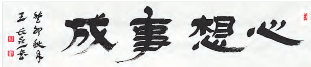
心想事成(书法) 王长喜 作