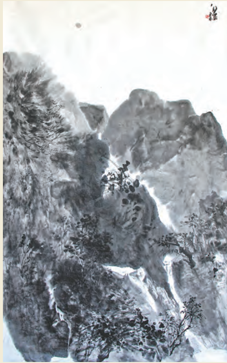
(本栏作品均由李弘林作)