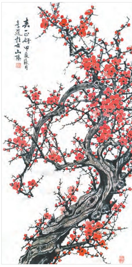
春正好(国画) 段景道 作

何处望神州?满眼风光北固楼。千古兴亡多少事?悠悠。不尽长江滚滚流。年少万兜鍪,坐断东南战未休。天下英雄谁敌手?曹刘。生子当如孙仲谋。(书法) 李怀栋 作