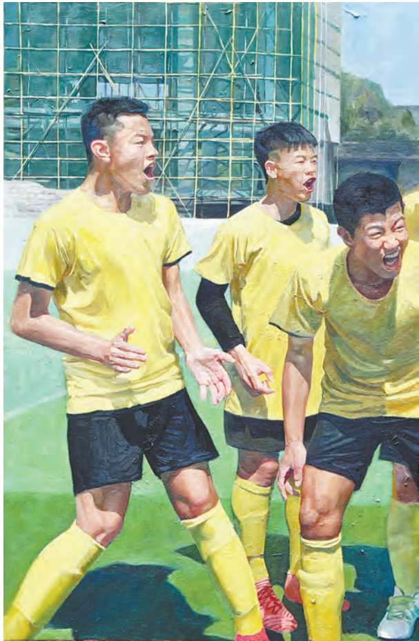
正在建设的青春(油画) 程帅亿 作