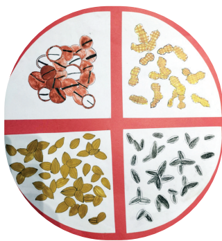
●马子轩 mg2311100 马村工小三(八)班