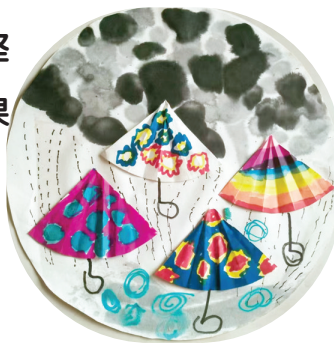
●梁靖熙 kx2401060 团结街小学二(二)班