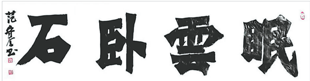
眠云卧石(书法) 范守奎 作