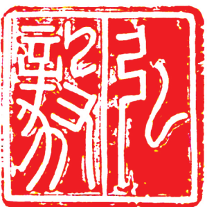
弘毅(篆刻) 贺永齐 作

碧海烟归尽,晴峰雪半残。冰泉悬众壑,云路郁千盘。影落齐燕白,光连天地寒。秦碑凌绝壁,杖策好谁看?(书法) 张乐意 作