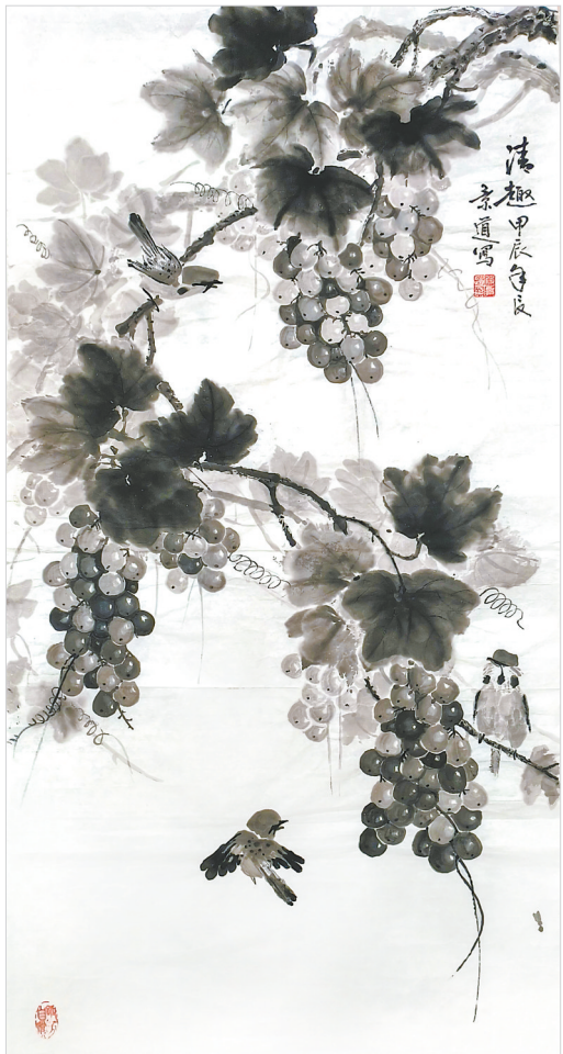
清趣(国画) 段景道 作