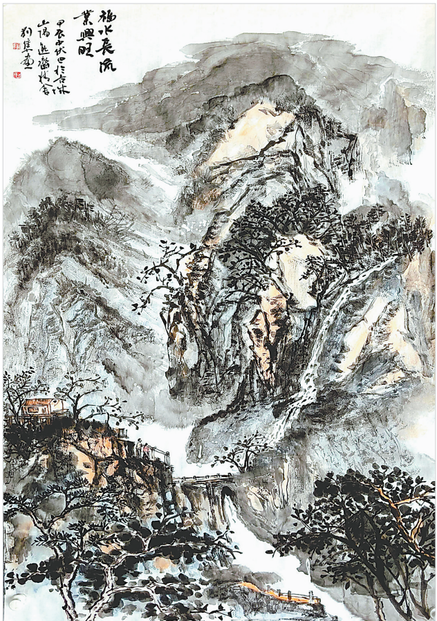
福水长流业兴旺(国画) 刘 隼 作