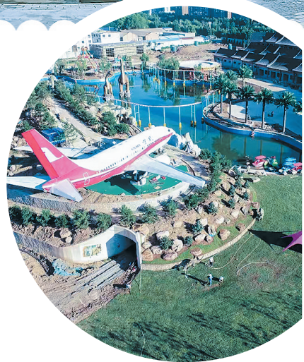
正在建设中的怀府恐龙园一景。