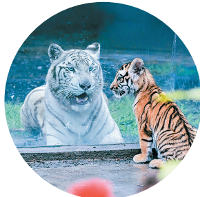
萌态可掬的东北虎。