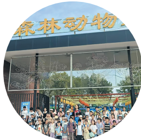
和生森林动物乐园迎来研学季。

该项目目前存栏动物品种百余种、1万多头（只），包含了亚洲象、白虎、金虎、长臂猿、猩猩、黑豹、长颈鹿、梅花鹿、金丝猴、斑马以及禽类等国家一级、二类稀有保护动物。项目开业以来，各项工作有序开展，受到了社会各界和广大游客的一致好评。