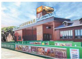
和生森林动物乐园前景。