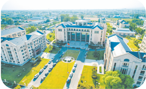
南水北调教育基地。

未来,围绕构建“一馆、一志、一院、一基地”新格局,立足焦作、面向全国开展多元化培训接待,以“文旅+研培”点亮焦作服务金字招牌,提升焦作对外的影响力和知名度。