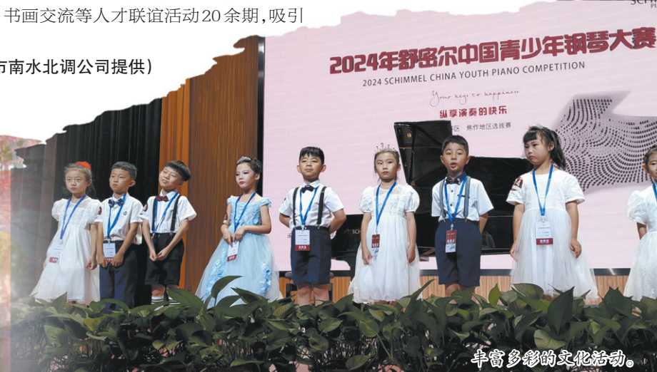
丰富多彩的文化活动。