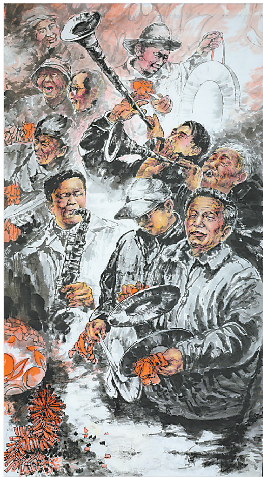
幸福锣鼓敲起来 群众生活美起来(国画) 郑清珍 作