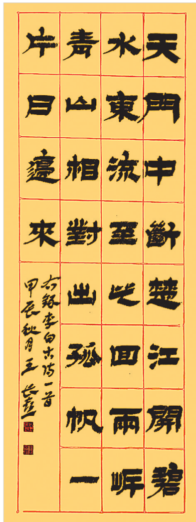
天门中断楚江开,碧水东流至此回。两岸青山相对出,孤帆一片日边来。(书法) 王长喜 作