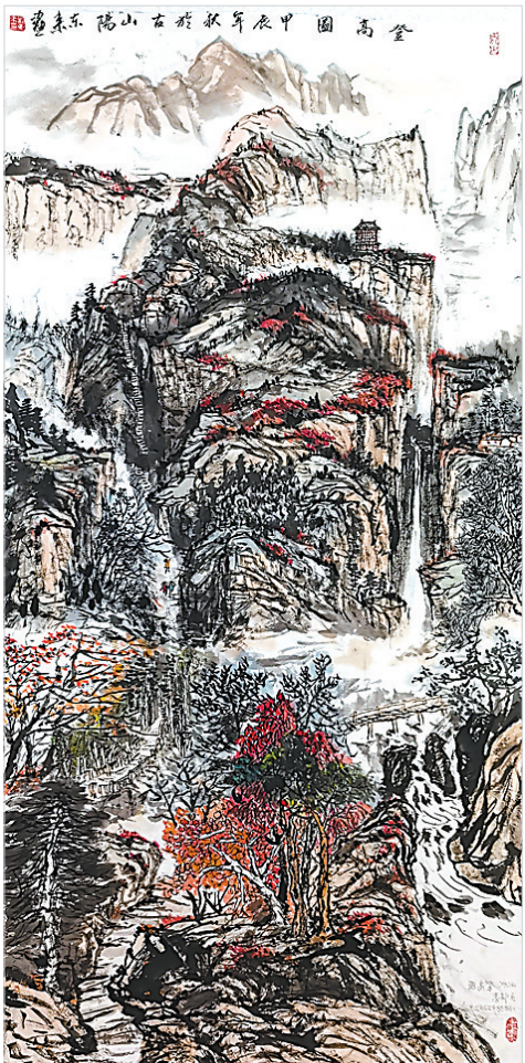
登高图(国画) 刘东来 作