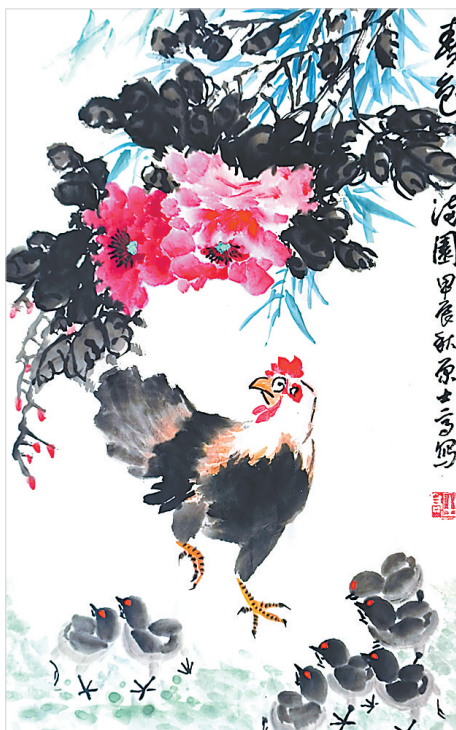
春色满园(国画) 原士高 作