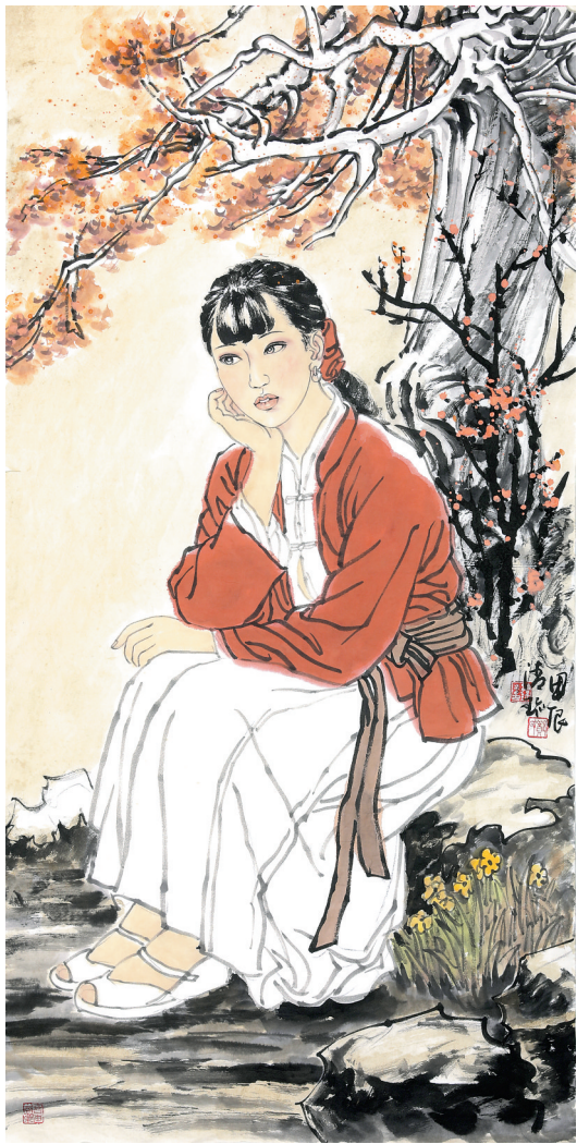
人如秋水玉为神(国画) 郑清珍 作