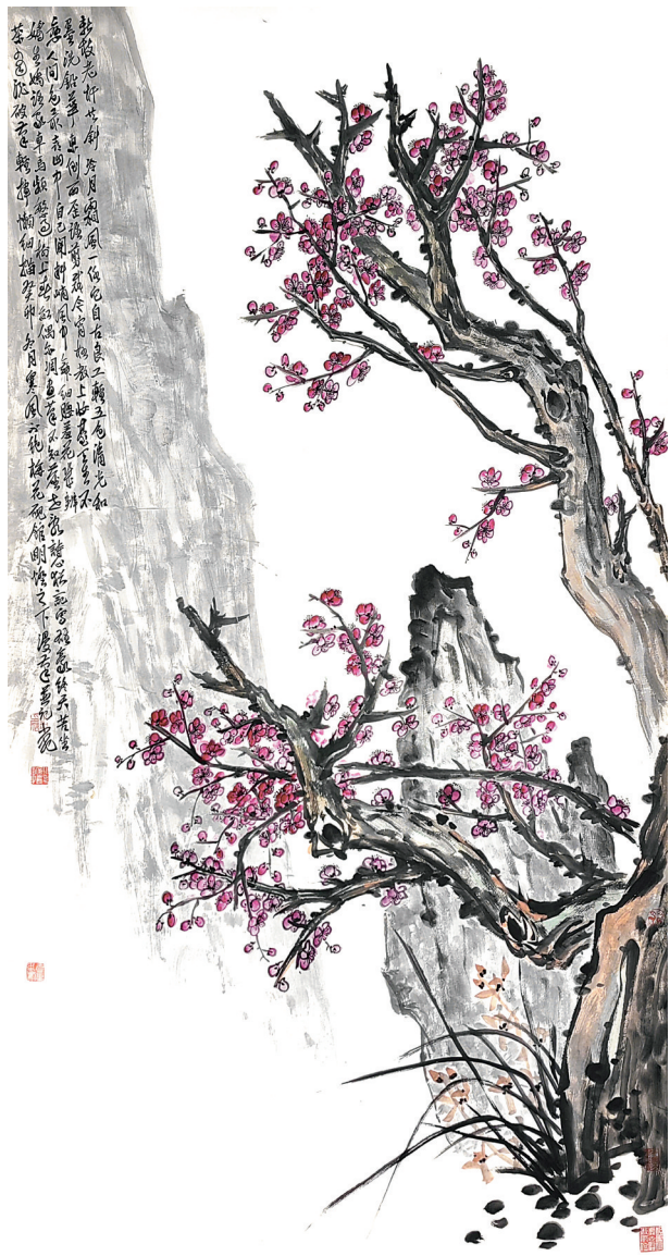
品若梅花香在骨(国画) 谢小毛 作