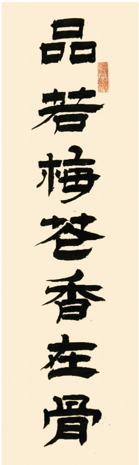
品若梅花香在骨,人如秋水玉为神(书法) 王长喜 作