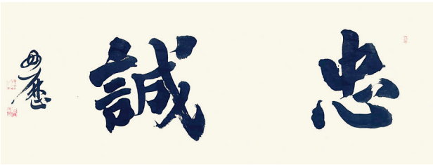
忠诚(书法) 毋立 作