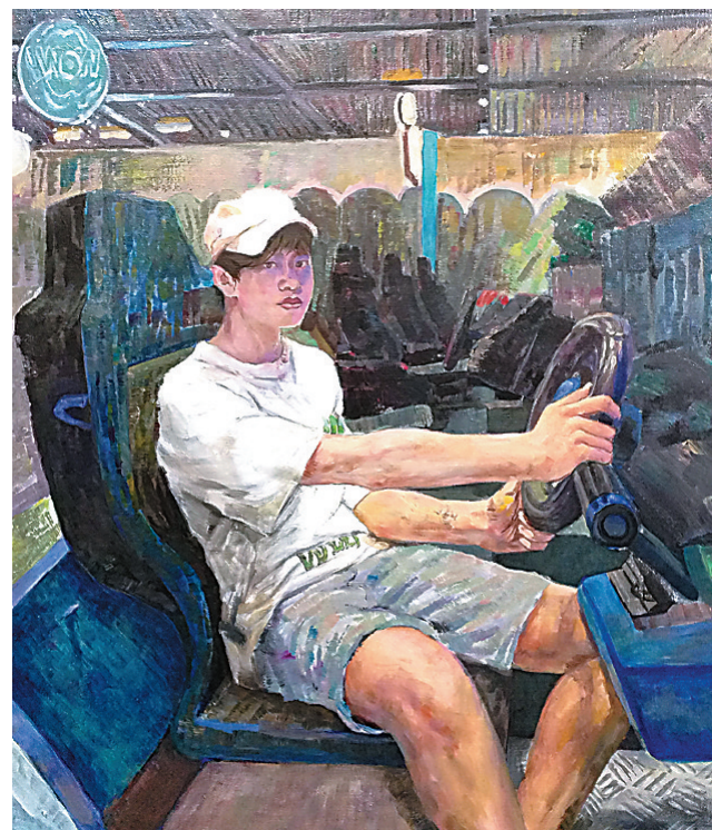
漫步的青春(油画) 程帅亿 作