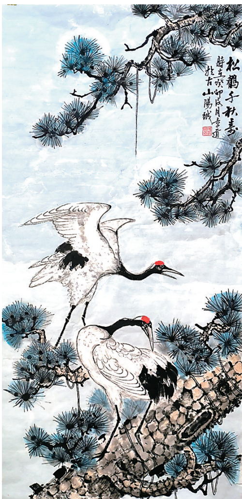
松鹤千秋寿(国画) 段景道 作