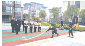
消防安全宣传员现场授课。

通过此次培训，飞天·时代锦苑物业服务中心工作人员不仅增强了消防安全意识，还进一步掌握了消防安全知识和自救技巧，对火灾预防工作起到促进作用。下一步，该中心将继续强化消防安全知识宣传，定期开展日常安全检查，对电器、线路、消防器材等进行排查，全面筑牢飞天·时代锦苑消防安全“防火墙”。