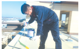
工作人员认真除锈。