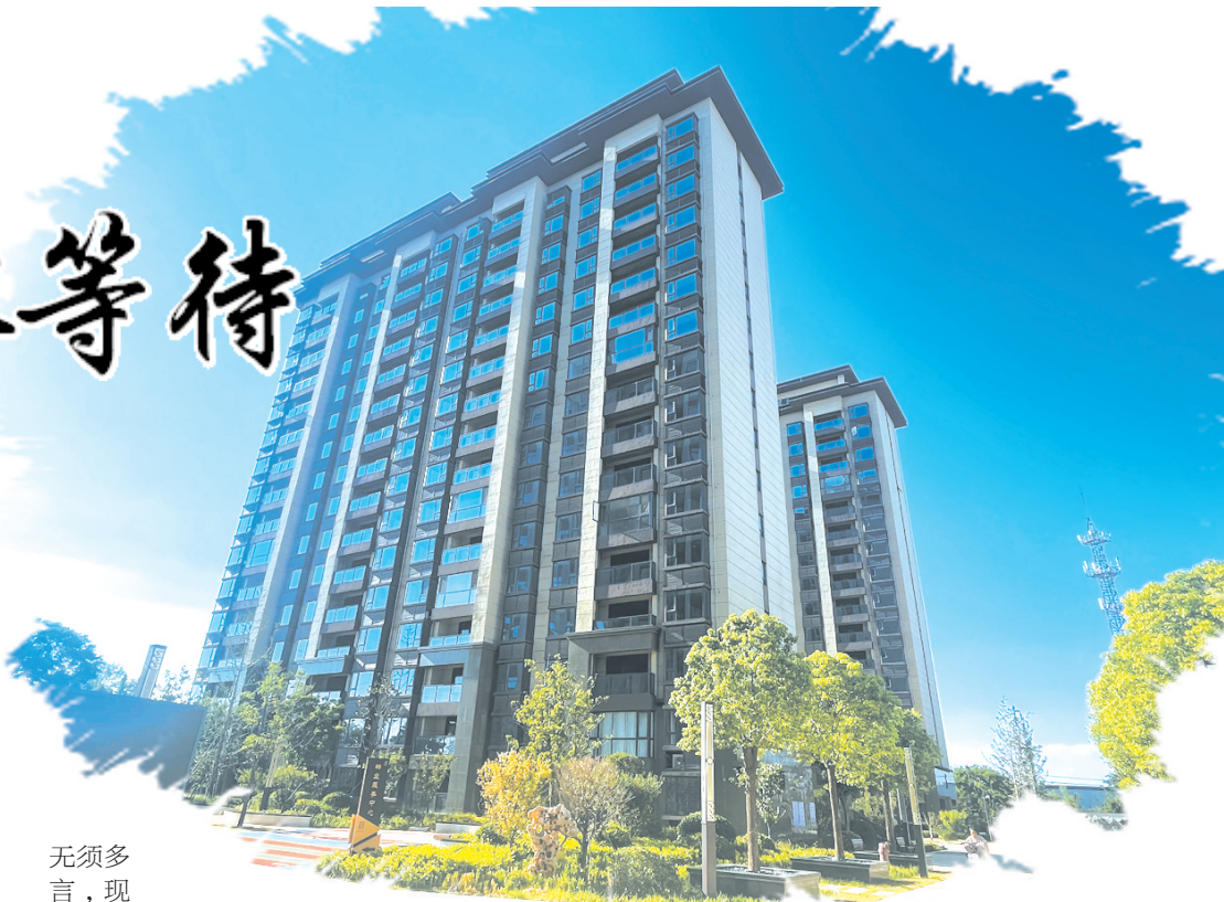
美丽的飞天·时代锦苑小区。

园林实景、户型品质看得见，节约等待时间，减少生活成本，所见即所享，幸福不等待。飞天·时代锦苑，给你即买即拿房的快乐。建筑面积135至276平方米全品类宽宅奢院，不动产证书正在办理中，国企品质，放心选购。