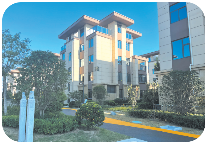
飞天·时代锦苑小区实景图。