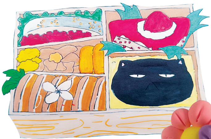
●陆乔楚 tn2412022 塔南路小学二(四)班 便当