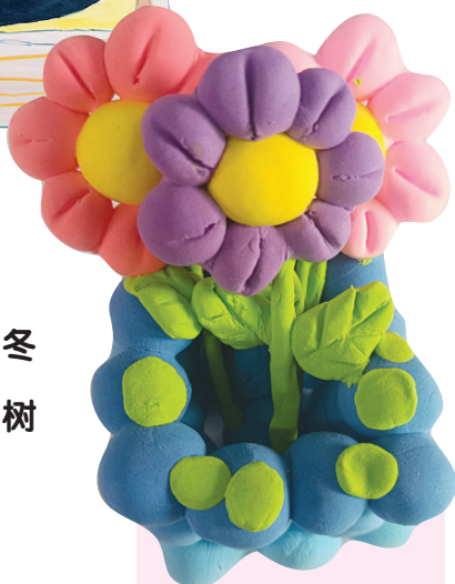
●白明熙 tn2412009 塔南路小学二(4)班 手工花朵