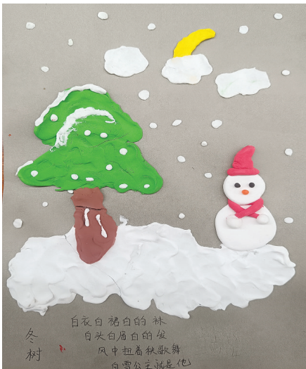
●洪浩宇 tn2412008 塔南路小学二(四)班 冬树