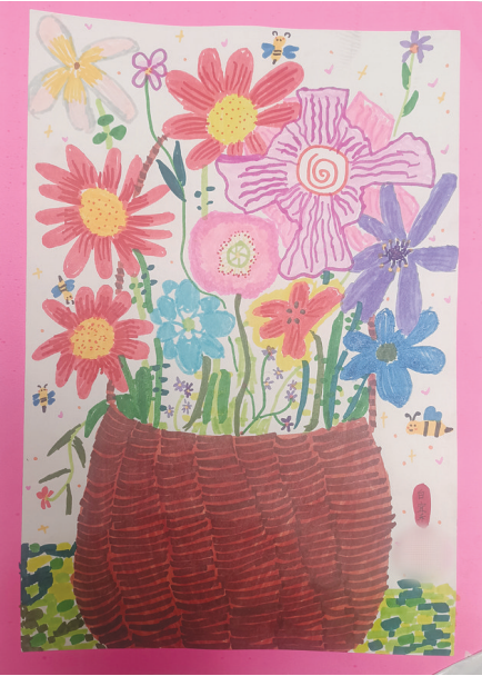
●白宜禾 sf2407015 高新区实验小学二(五)班 把春天带回家