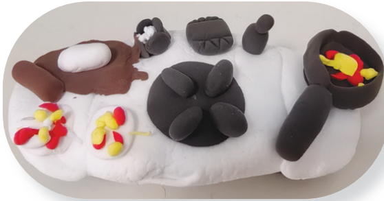
●马雯一 dq2412121 市道清小学二(一)班 (指导老师:过江) 迷你小厨房