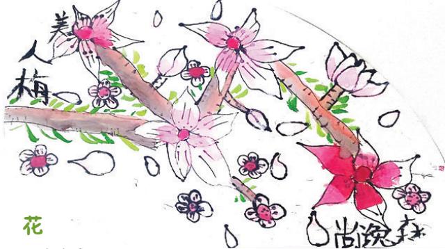
花 ●尚逸森 jy2504122 解东一小二(2)班(指导老师:王海玲)