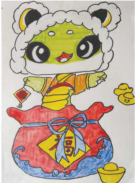
●贾絮琰 jy2504097 解东一小二(五)班 福袋蛇

我妈妈长得十分漂亮。她有些胖,身高165cm,一头短发染成了棕色,戴着一副大大的眼镜,看起来很时尚也很温柔。妈妈很勤劳。她一下班回到家,就开始和姥姥一起做饭。饭后,她又到厨房洗碗。洗好碗后,她又开始辅导我和姐姐做作业。我们做完作业后,妈妈就陪着我和姐姐一起玩耍,然后催促我们刷牙、洗脸……我们洗完后来睡觉,妈妈又开始洗衣服、做家务到凌晨。第二天,大早上她做好早餐,把我们叫醒,让我们吃饭,送我们上学。这就是我的妈妈,一个既普通又平凡的妇女。但在在我心中,她是一个无所不能的人。(指导老师:王海玲)