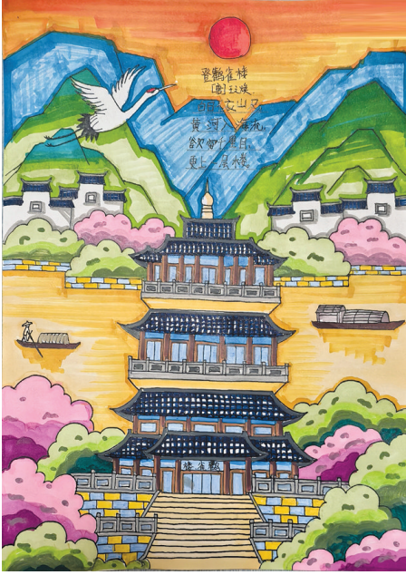
●靳书承 jy2504069 解东一小二(三)班 登鹤雀楼