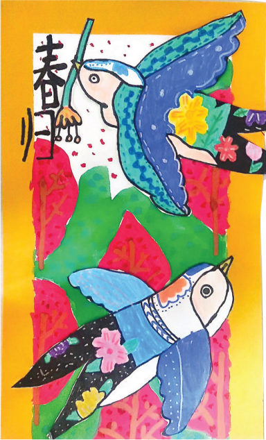
●尚逸森 jy2504122 解东一小二(二)班 (指导老师:王海玲) 春 归