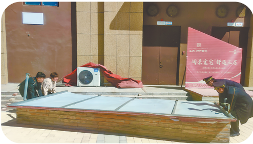
工作人员全力将翻倒的展板扶起。

5月5日,狂风裹挟着沙尘在飞天·时代锦苑小区内呼啸,小区道路两侧的树木在风中剧烈摇晃,停放在单元门口的几辆电动车被吹得东倒西歪。一辆业主停放在户外的电动三轮车,终究没能抵挡狂风的猛烈侵袭,被吹翻在地,横亘在小区通道上,影响了居民的正常通行。