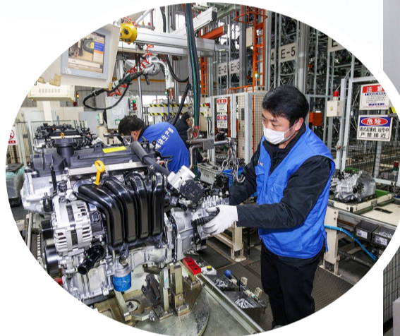
江苏摩比斯组装车间

面对新一轮科技革命和产业变革,我区将围绕“重振千亿汽车”目标,坚持传统燃油车、新能源汽车“两条腿”走路,不断推动整车产销提质、零部件协同发力,打造出口汽车和新能源汽车生产基地,持续推动汽车产业转型升级和高质量发展,为推进中国式现代化盐城经开区新实践注入强劲动能。