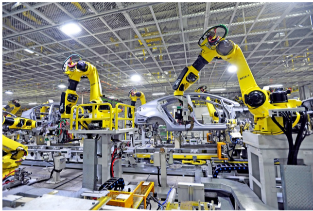
悦达起亚三厂智能化生产线

作为中国新能源汽车的新锐品牌,摩登汽车坚持以技术及“智造”为支撑,以“中国制造、世界品质”为标准,与国际市场接轨,与国际品牌竞争,持续加速海外市场的拓展步伐,已相继进军中北美洲、南美洲、中东、中亚等市场,实现包括墨西哥、以色列、意大利、匈牙利、厄瓜多尔、多米尼加等十多个海外国家和地区的出口。