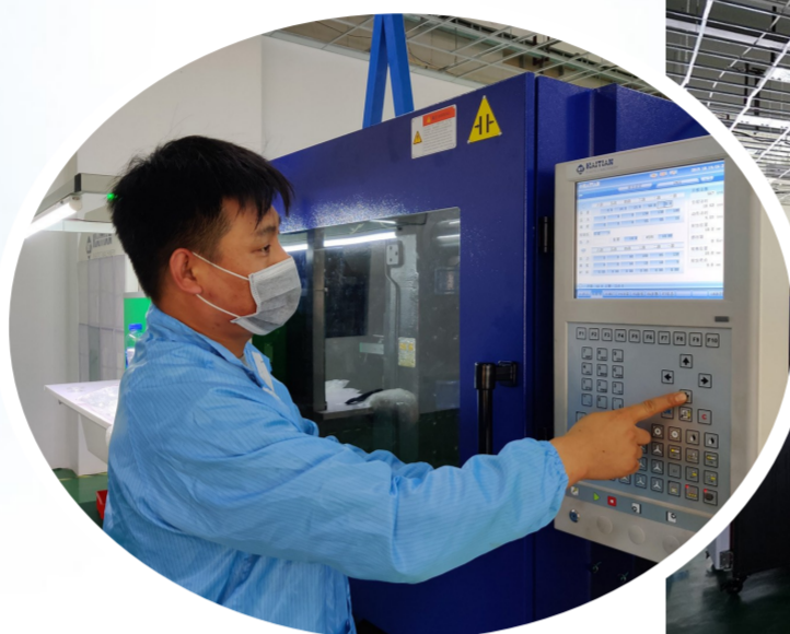
输入设备运行参数

谁在创新上先行一步，谁就能拥有引领发展的主动权。截至目前，贝尔光电先后获得了25项实用新型专利、6项发明专利。产品广泛应用于舞台灯、投影灯、TV背光、车灯等领域，与富士照明、绿源电动车、鸿佳电子等多家知名企业保持着长期良好合作关系。