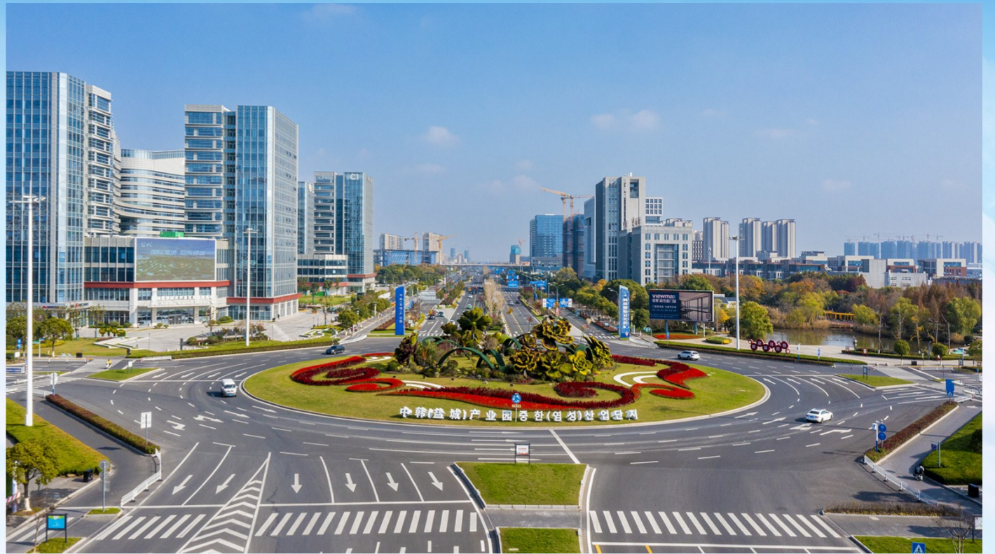
中韩(盐城)产业园产城融合核心区

在重要时间节点持续发力。2022年是中韩建交30周年,围绕“重要事记、经贸合作、人才交流、友城互动、历史记忆”五大方面,推出《跨越山海》盐城·韩国友好交往30周年大型画册,从时间长河中撷取盐韩30年交往的珍贵图片、纪实史料、动人瞬间和精彩故事。2023年,是习近平总书记共建“一带一路”倡议提出十周年,江苏卫视联合16个省区市、20家主流新媒体平台,共同推出大型跨区域联动直播节目《大道之行,筑梦丝路》,成功播出7分30秒时长的中韩(盐城)产业园专题报道,集中展示了盐城打造“一带一路”合作创新国家级标杆的成