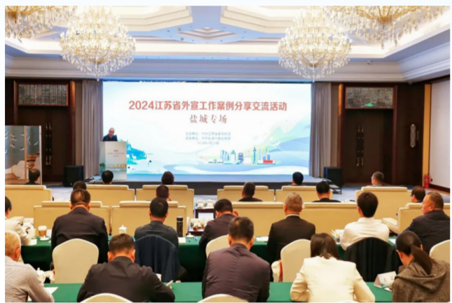
2024江苏省外宣工作案例分享交流活动

近年来,我区不仅积极参与组织市、区两级联动组团赴韩交流,拜访韩国友城、政府部门、行业协会和知名企业,还先后承办泛黄海中日韩经济技术交流会等一系列经贸活动,主动设置议题、全球顶格推送,形成了央媒外媒、地方网站、政府网站、商业网站多声部发声、多渠道传播的叠加效应。其中,第五届中韩贸易投资博览会有50余家中外媒体、160多名记者参加报道,在20多个国家和地区、200多家境外媒体,刊用稿件600多篇,覆盖全球5亿受众。