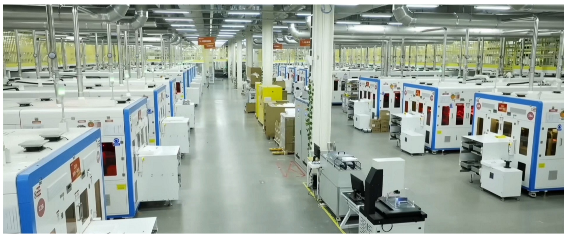
智能化光伏组件车间