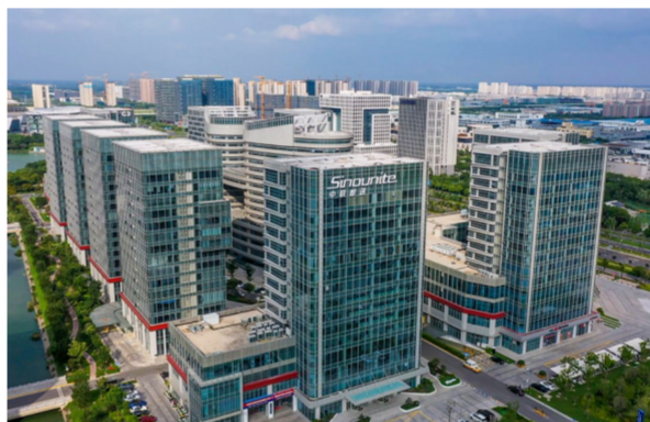
中联即送总部大楼