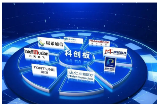
科学的风险管控机制确保投资决策的可靠性

过多维度论证决策后,最终实际投资项目只有23个。科学的风险管控机制确保了投资决策的可靠性,最大限度降低了投资风险,提高了投资成功率。